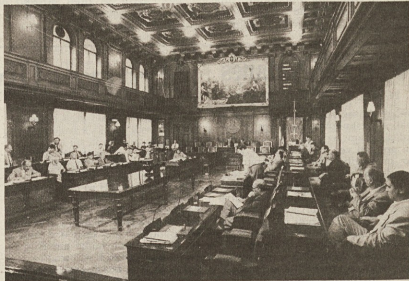
Včerajšnje zasedanje tržaškega občinskega sveta