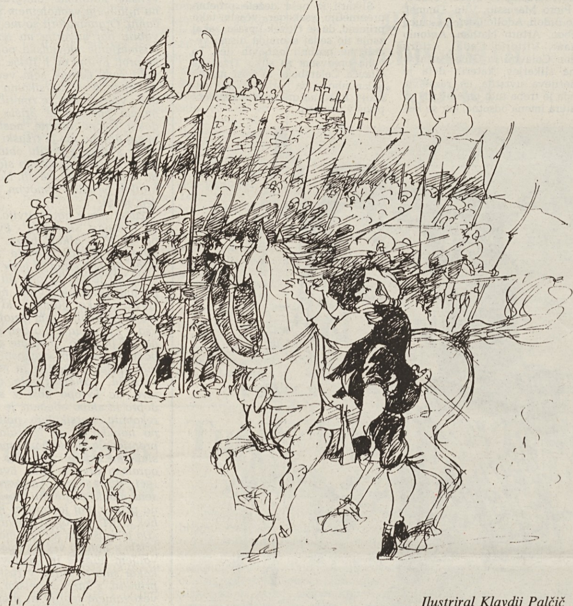
Ilustriral Klavdij Palčič

»Kaj boste odgovorili na povelje in vprašanje visokega gospo-