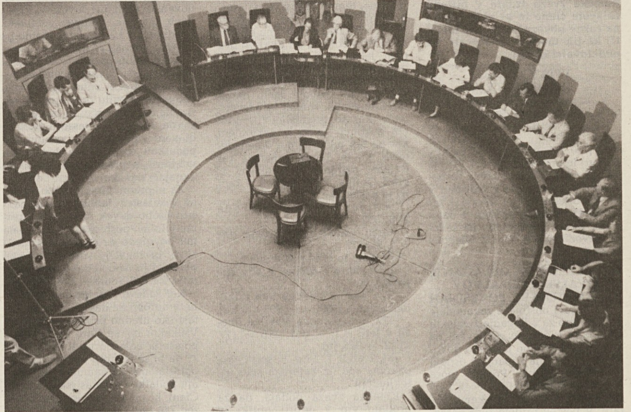
Včerajšnje dolgo in polemično zasedanje tržaškega pokrajinskega sveta