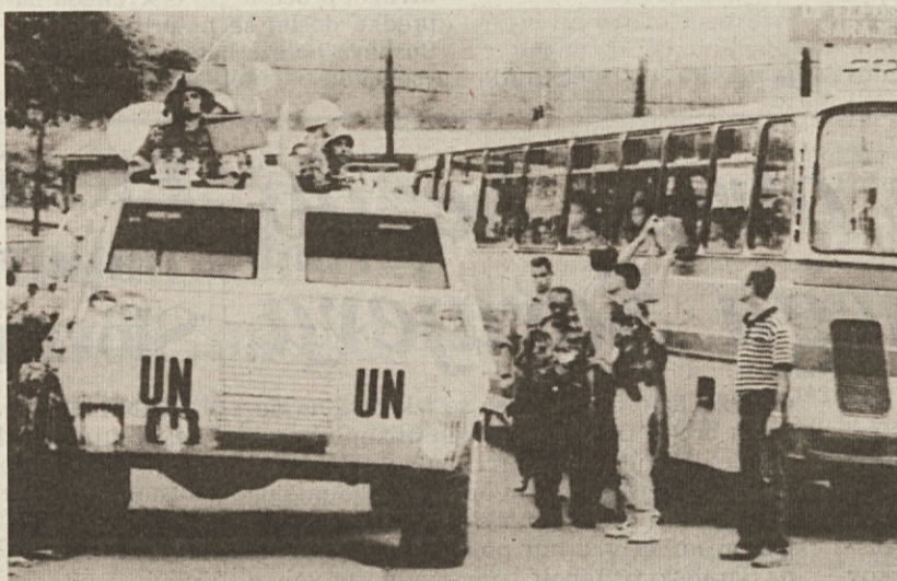
Iz Sarajeva je včeraj s 5 avtobusi odšlo 300 otrok in žensk