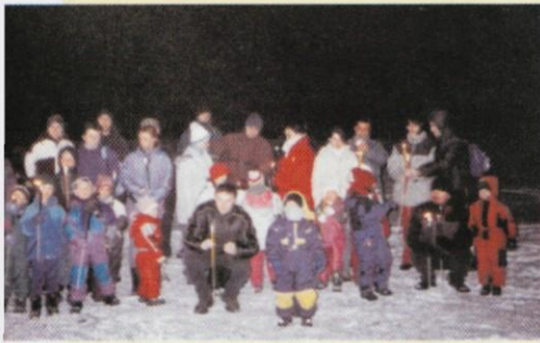
Gorski škratje z baklami - 30. 1. 2004