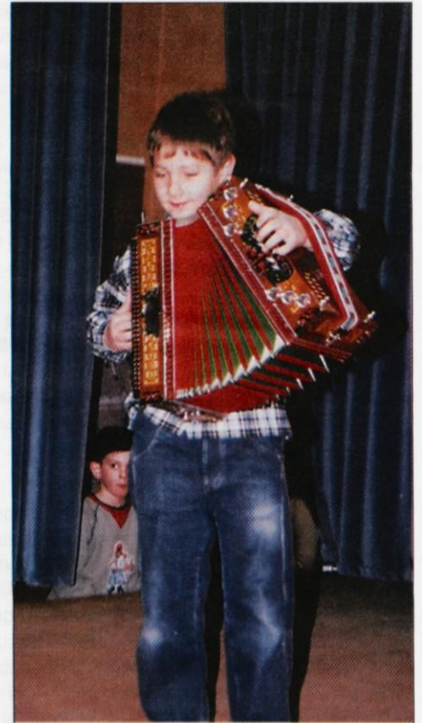
Mladi harmonikar iz Krašnje

Program se je pričel s kulturno prireditvijo, kjer so nastopali recitatorji, pripovedovalci, kar trije harmonikarji, kitarist in