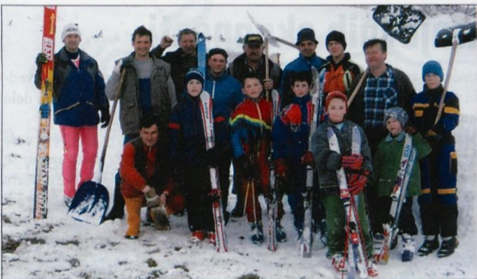
Pri pripravi skakalnice so sodelovali tudi najmlajši.

Težko pričakovani sneg nam je le omogočil, da smo v Športnem društvu Zlato Polje pripravili tekmo v smučarskih skokih, tokrat za drugi pokal Občine Lukovica.