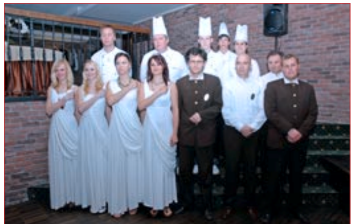
Ekipa hotela Primus, ki je poskrbela za nepozaben vinsko-kulinaričen dogodek.