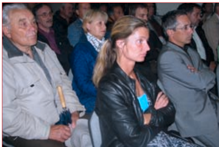
V Stari steklarski so se zbrali številni Ptujčani in Ptujčanke, ki jim ni vseeno, kaj se dogaja s starim mestnim jedrom.

kaj se dogaja s tem delom mesta. "Iz starega mestnega jedra se umikajo drobno gospodarstvo in trgovine. V tem trenutku je