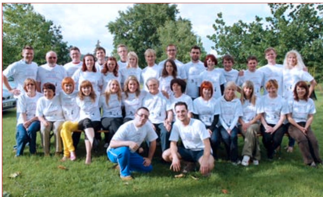
Stara garda ponovno skupaj.

Pripravila sta nepozabno popoldansko in večerno druženje, ki je bilo plesno obarvano, saj so nekdanji plesalci na šaljiv način izvedeli, koliko od osvojenega plesnega znanja še »imajo v nogah«. Pravijo, da tega nikoli ne pozabiš in tudi videti je bilo tako. Obujanje spominov in dogodkov se je zavleklo pozno v noč. »Stara Garda«, kot sta nas poimenovala organizatorja, še ni za staro železo in želja obeh je, da bi srečanja postala tradicionalna.