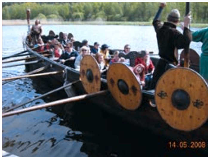
Na viking dnevu smo se preizkusili v veslanju

Naši učenci so drugi in zadnji dan obiska preživeli v šoli s svojimi vrstniki. Čudili so se marsikateri razliki med slovensko in švedsko šolo, najbolj pa, ko so slišali, da učenci do 8. razreda