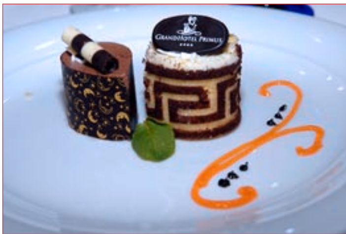
Primusova tortica s pistacijevno kremo ob čokoladni kapljici z lešnikovim moussom.