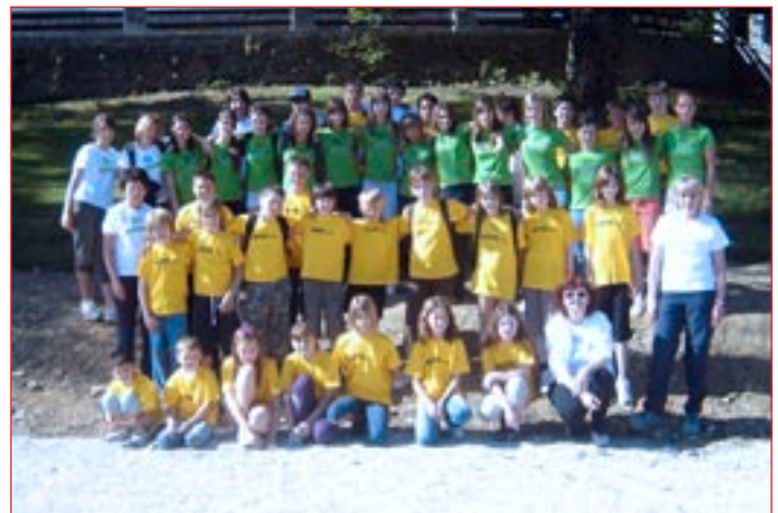
Skupni posnetek sodelujočih na taboru za nadarjene učence.

Poleg športa so bili učenci razdeljeni v skupine po interesu, v katerih so potekale različne ustvarjalne delavnice: naravoslovne (življenje v potoku, Legoboom – sestavljanje robota, zabavna matematika), jezikovne (retorika, angleška in novinarska delavnica, kriminalni roman, kvizi in uganke) in umetniške (izdelovanje izdelka iz naravnih materialov, kiparjenje iz gline, fotografska delavnica, plesna in glasbena delavnica). Posebej