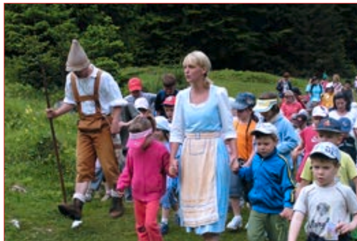
S Kekcem in Mojco v Kekčevo deželo.

Po gozdni poti smo se najprej peš odpravili do Bedančeve hiše. Ker Bedanca na srečo ni bilo doma, smo lahko vstopili v njegovo hišo in si ogledali notranjost. Videli smo velik kotel, Bedančevo posteljo, veliko nagačenih živali, živalskih kož, gugalnico pred hišo ... Pred hišo je visel velik kotel, v katerem je Bedanec kuhal, okoli njega pa so se sušile živalske kosti in kože. Pot smo nadaljevali proti Kosobrinovi hiški, vmes pa smo pomagali rešiti našo vzgojiteljico, ki jo je Bedanec ujel v past – mrežo. Med potjo smo srečali Bedanca, ki so ga otroci pregnali