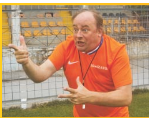
Novi ZATO, Rabeljeva vas 15c, 2250 Ptuj