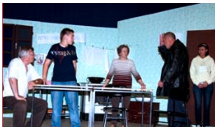
Z vaje za predstavo "Moj ata socialistični kulak"

V spomladanskem roku bodo predstave na gradu Vurberk od petka, 27. junija, do torka, 2. julija 2008, vsak večer ob 20. uri. Vstopnice bodo v prodaji eno uro pred predstavo. Cena vstopnice za odrasle znaša 5 EUR, za otroke in mladino do 18. leta starosti pa 2,5 EUR.