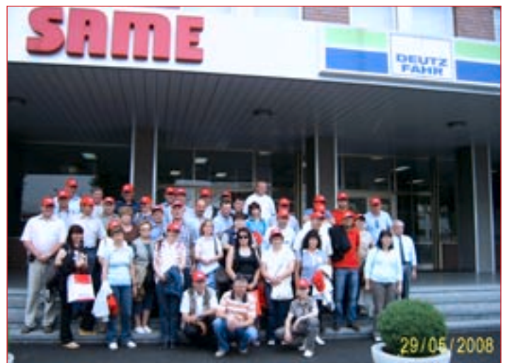
Skupinska slika pred tovarno.

družbe Same Deutz – Fahr Group. Izvedeli so, da ležijo pokrite proizvodne površine družbe na več kot 20 hektarjih. Družba ima okoli 2000 zaposlenih v proizvodnji, okoli 150 visoko strokovno usposobljenih sodelavcev dela v razvojnem oddelku, 60 raziskovalcev pa dela na razvoju prototipov. Traktorje omenjenih znamk izvažajo v kar 93 držav sveta, dobršen del proizvodnje