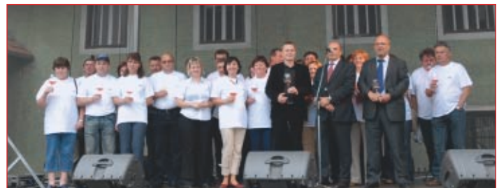
Vsi zaposleni v Ptujski kleti s predsednikom uprave Perutnine Ptuj.

Na najstarejšem in prestižnem mednarodnem vinskem ocenjevanju Vino Ljubljana , ki je letos potekalo že 54., so najzahtevnejši vinski ocenjevalci z vsega sveta vinom iz Ptujске kleti podelili kar dva svetovna šampiona za dve polnitvi. V kategoriji belih suhih vin je bilo svetovno šampionsko odličje dodeljeno Pullusu sauvignonu, medtem ko je svetovnega šampiona v kategoriji penečih vin prejela Pullus penina rose. To je kar polovica letos v Ljubljani dodeljenih najvišjih vinskih odličij. Poleg tega je naša klet dobila tudi tri srebrne medalje, in sicer za Pullus sauvignon limited edition, Pullus cuveé 7 sodov in Pullus traminec. S tem je postala absolutni zmagovalac letošnjega vinskega ocenjevanja. Ta uspeh je spodbudil Ptujčane, da bi svetovnim vinskim šampionom v mestu postavili ustrezno trajno obeležje v obliki dostojnega trajnega spomenika tako eminentnemu svetovnemu dosežku.