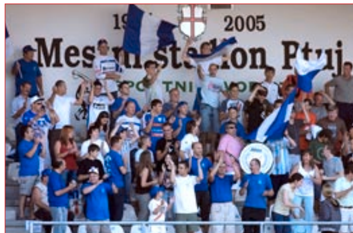
Modri kurenti, navijaška skupina NK Drava.

Le zgledna in uspešna selekcija z nadarjenimi fanti s širšega območja Ptuja in drugih koncev Slovenije nakazuje, da naj bi stadion na Čučkovi v prihodnosti pomenil simbol moči in spektakularnega nogometa.