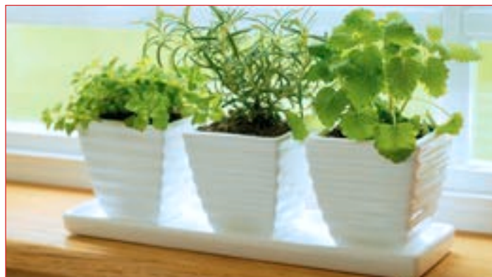
Zelišča lahko gojimo kar na okenski polici.

Rastline so bile v človeku vedno potrebne kot vir najrazličnejših surovin. Izkoriščanje se je kdaj pa kdaj spremenilo v pravo opustošenje. S krčenjem zelenih površin, z uničevanjem gozdov je človek grobo posegel v rastlinski svet: vplival je na sestavo tal in na klimo, na spremembo hidrografskih razmer in tako zmotil naravni tok v razvoju rastlinske odeje. Razvoj civilizacije je torej povzročil ogromne spremembe v naravi: nedotaknjene naravne površine so se zmanjšale, dosedanj viri hrane niso več zadostni.