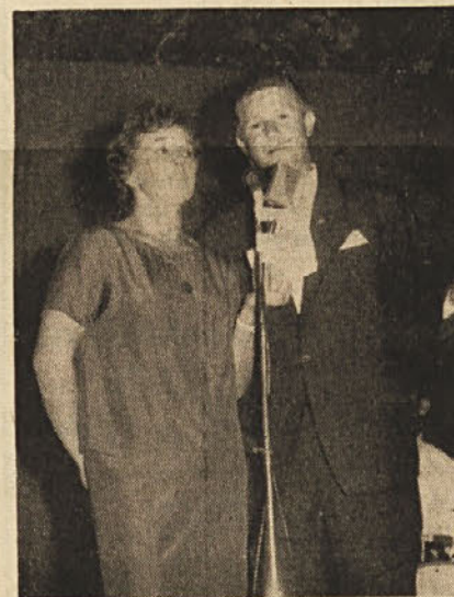
Duet iz Trebč

Po govori se je nadaljeval kulturno-zabavni spored. Nastopili so mladi pevci in pevke iz Pončane, katere je spremljal mali orkester. Mladi pevci iz Pončane niso tuji naši javnosti in kjer koli so doslej nastopili, so