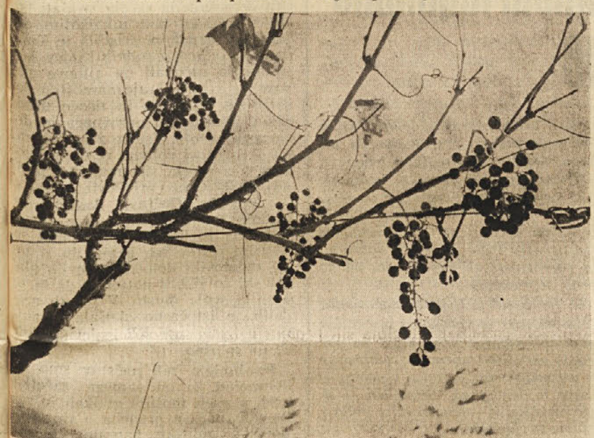
Slika z vinograda na Tržaškem