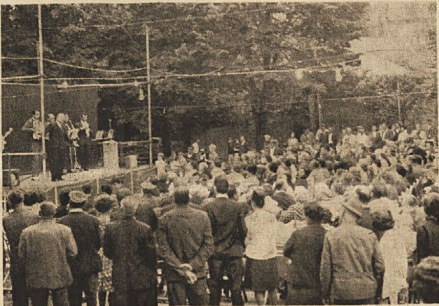
Nastop skupine iz Trebč

V nedeljo so tovariši z Opčin in iz Trebč priredili skupen praznik komunističnega tiska v Prosvetnem domu na Opčinah. Praznik je vsestransko zelo lepo uspel. Že okrog tretje popoldanske ure so se začeli zbirati obiskovavci na dvorišču Prosvetnega doma, kljub temu, da je bilo vreme precej nestanovitno in da so temni oblaki obetali dež.