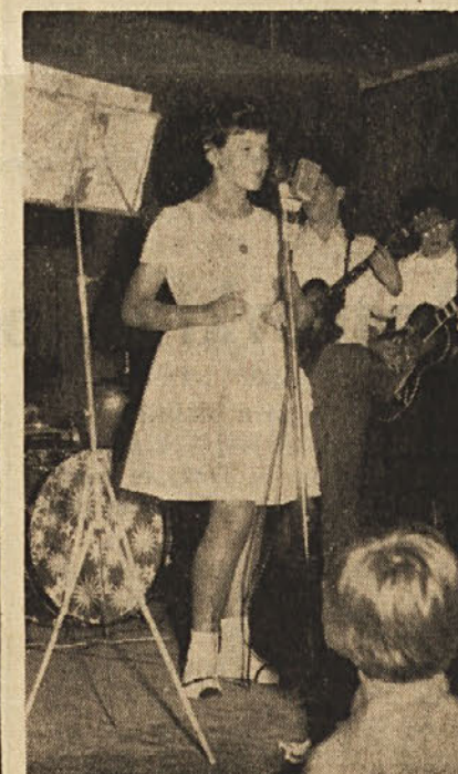
Simpatična pevka iz Pončane

Sele v poznih večernih urah je bil izčrpan program, nakar je sledila prosta zabava, ki je trajala do polnoči.