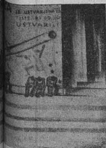
...ste, ki so ustvarili"