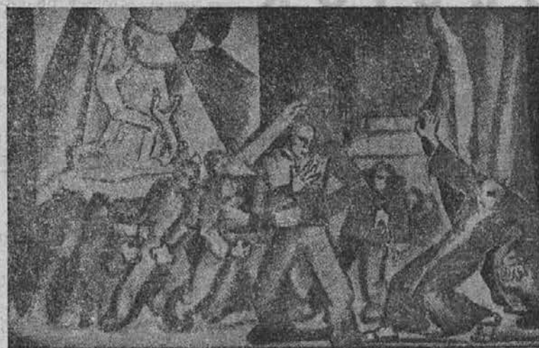
"Pravice ni pod nebom".

POVEDUJEM, OR SE JE PO RESNICI A Z VSEMI SVOJIMI ČANSKIMI KRIVICAMI SO VELIKO ŽALOSTJO BENE LAŽI NI ZRAVEN, LEPIH BESED IN NOBENE AVŠČINE