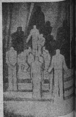
"Pravica je ustvarjena"

spodar in Jernej: gospodar bo sedel na zaprti kuhinji, si bo palil pipo in bo prijetno dremal; Jernej se bo skrival za hlev in bo poginil na gozdu. Tako je naredila posvetna postava. Boga žja zapoved pa je naredila: trpi krivico Jernej in kadar te udari sosed na desno lice, nudim še levo."