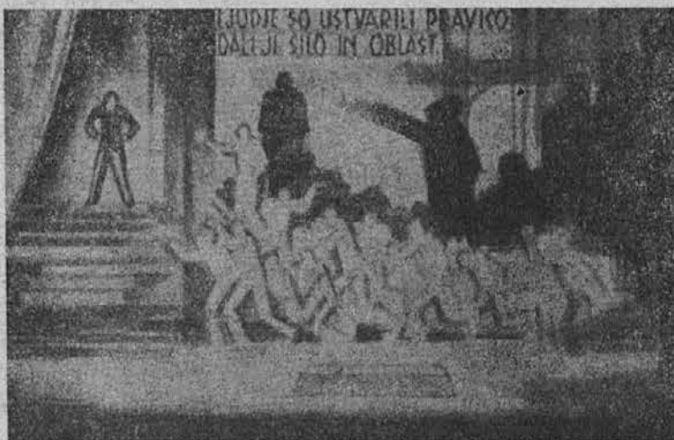
"Ljudje so ustvarili pravico, dali ji silo in oblast."