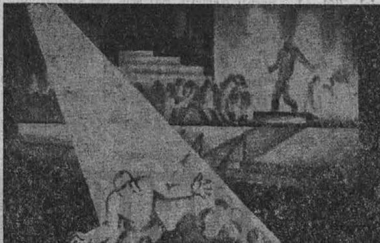
...ljudje božji, glejte ga: ali naj poklekнем predenj?"