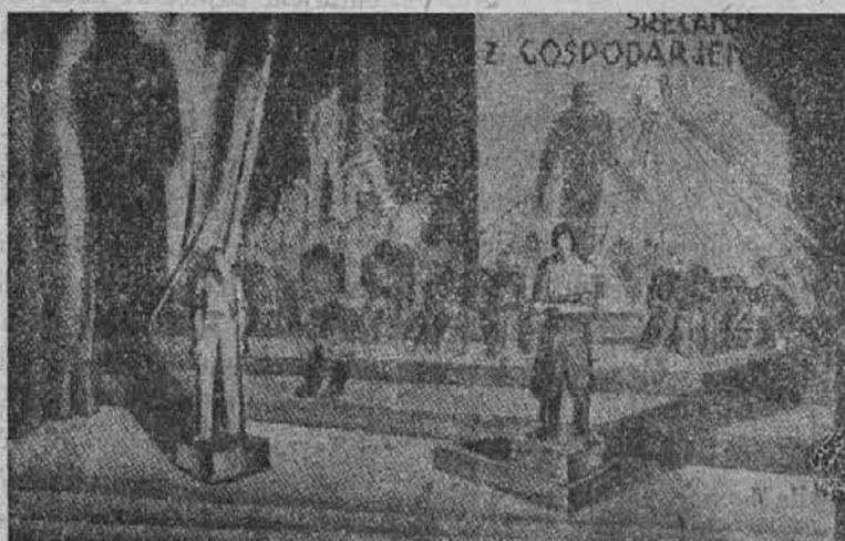
"Srečanje z gospodarjem"

"Jernej, tako je naredila posvetna postava: Jednej bo zidal hišo in kadar jo bo dozidal: gospodar na peč, Jernej čez prag; Jernej bo oral in bo sejal in žel: gospodarju žetev in kruh, Jerneju kamen; Jernej bo kosil in mlatil, spravljaj sero in slamo, in ko bo napolnil skedenj in podstrežje: gospodar na mehko posteljo, Jernej na trdo cesto; postarala se bosta go-