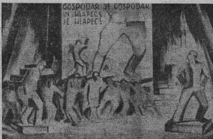
"Gospodar je gospodar in hlapec je hlapec!"