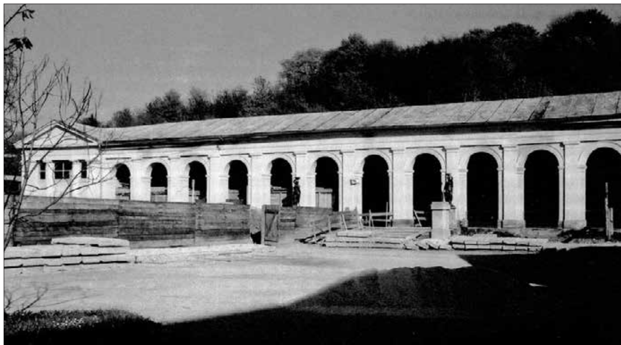
Pokrito sprehajališče, wandelbahn, v Zdravilišču Rogaska Slatina v začetku 60. let 20. stoletja. Takrat je zdravilišče dobivalo povsem novo podobo, kjer ni bilo več mesta za wandelbahn iz leta 1843 (vir: arhiv ZVKD Slovenije, območna enota Celje, foto: Roman Fonda, 1963).

ren drugemu sodobno preobraženemu zdraviliškemu jedru, kjer so v šestdesetih letih 20. stoletja postavljali armiranobetonske zgradbe z imeni Terapija, Hotel Donat, Pivnica, Hotel Sava in druge. V nekaj letih je zdravilišče dobilo povsem novo, moderno podobo, ki so se ji morali umakniti omenjeni wandelbahn , zdraviliška vrtnarija, mostički in nekatere poti, že leta 1953 pa tudi izvirska mineralna voda Tempel, ki je do gradbenega posega v tla zdraviliškega jedra vrela