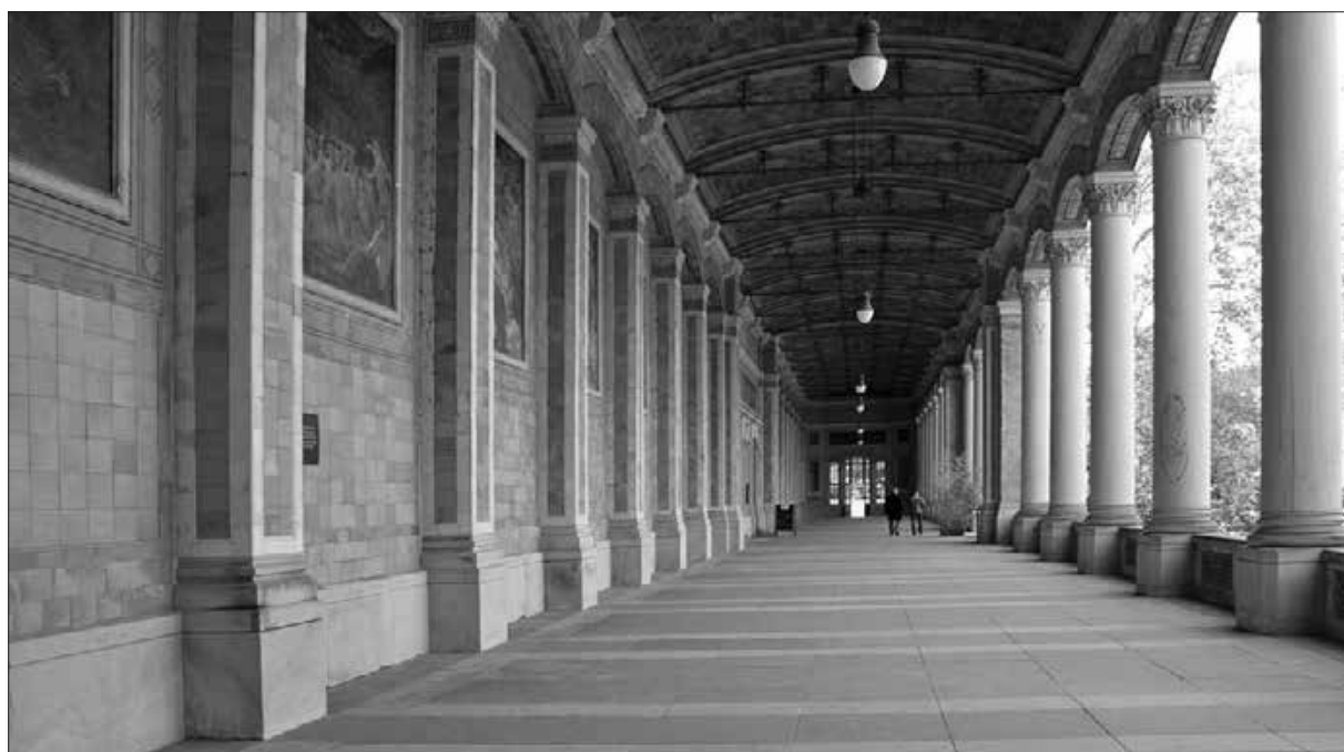
Baden Baden, wandelhalle, zgrajen v letih 1839–1842.