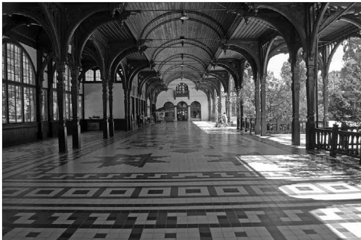
Szczawno-Zdrój, wandelbahn iz leta 1893.