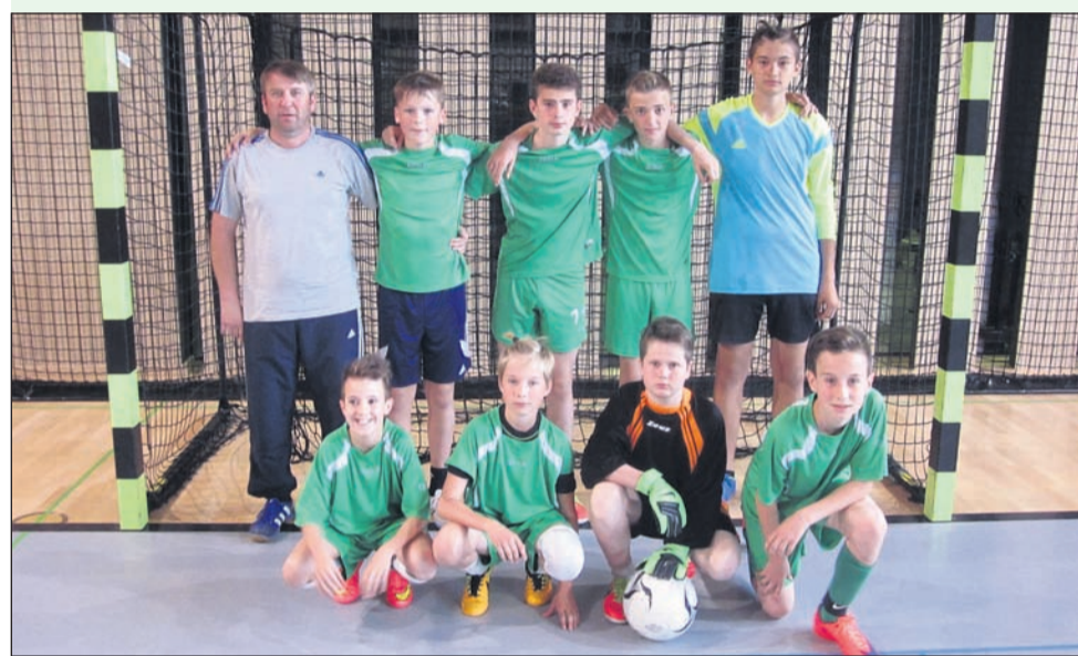
Ekipe OŠ Videm-Leskovec je postala zmagovalka medobčinskega tekmovanja v nogometu za učence letnika 2002 in mlajše, na območnem tekmovanju pa so osvojili končno 2. mesto.

OŠ Markovci, 3. OŠ Cirkovce, 4. OŠ Destrnik-Trnovska vas; skupina D (ŠD Juršinci, 15. 4.): 1. OŠ Breg, 2. OŠ Ljudski vrt, 3. OŠ Mladika, 4. OŠ Juršinci.