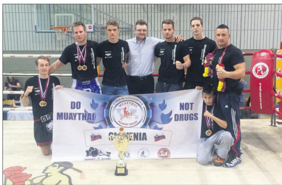
Ekipa Muay thai gym Ptuj je postala zmagovalec mednarodne lige.

V mednarodni ligi so tekmovali tudi v ekipnem klubskem tekmovalstvu - sodelovalo je 26 klubov iz 12 držav. Iz vsakega kroga je šlo le 5 najboljših rezultatov tekmovalcev. V predzadnjem krogu so Ptujčani še delili skupno dru-