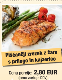
Piščanci zrezek z žara s prilogo in kajzerico

Cena porcije: 2,80 EUR (cena vsebuje DDV)