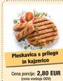
Pleskavica s prilogo in kajzerico

Cena porcije: 2,80 EUR (cena vsebuje DDV)