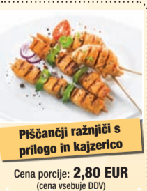
Piščanci različni s prilogo in kajzerico

Cena porcije: 2,80 EUR (cena vsebuje DDV)