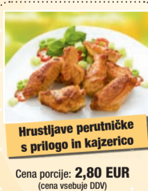
Hrustljave perutničke s prilogo in kajzerico

Ob predložitvi tega kupona ste na prireditvi upravičeni do posebne cene enega izbranega obroka. Izbirate lahko med: