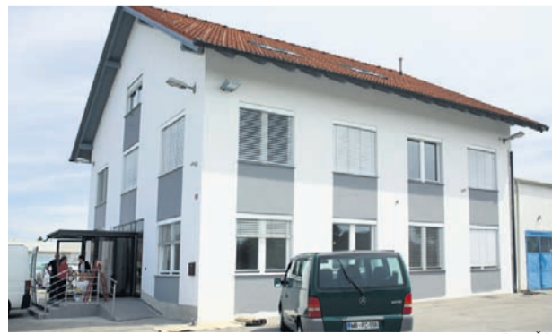
Novi prostori uprave Vrtca

Ptuj • Kako „dobro“ promoviramo svoje mesto