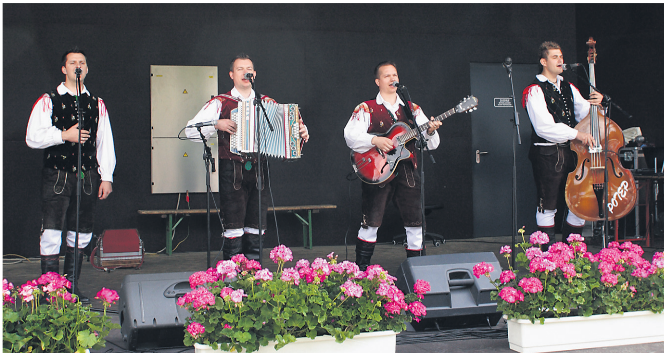
Ansambel Potep, najbolj všečen ansambel letošnjega predizbora

Po številu prijavljenih ansamblov je letošnji predizbor sicer presegel lanskega, po kvaliteti pa ni izstopal. Kvinteti so bili znova v manjšini, le štirje med 16 ansambli, pa še ti