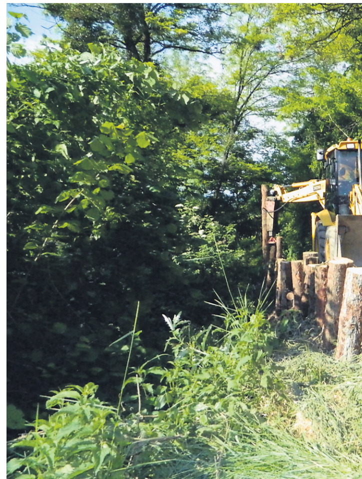
Družina v Majskem Vrhu je osem mesecev potrpežljivo tvorila vrečke do

Visoka trava res ponekod ovira pogled na levo in desno, ampak po haloških ovinkih je tako ali tako iz varnostnih razlogov bolje voziti nekoliko počasneje. Kar se tiče varnosti, pa je treba tudi omeniti, da so mnogi nepregledni ovinki opremljeni z ogledali, da voz-