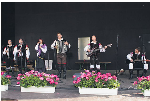
Ansambel KGB kvintet iz Starš