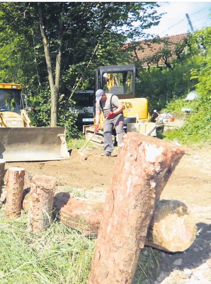
svoje hiše, ker se zaradi plazov do nje niso mogli pripeljati.