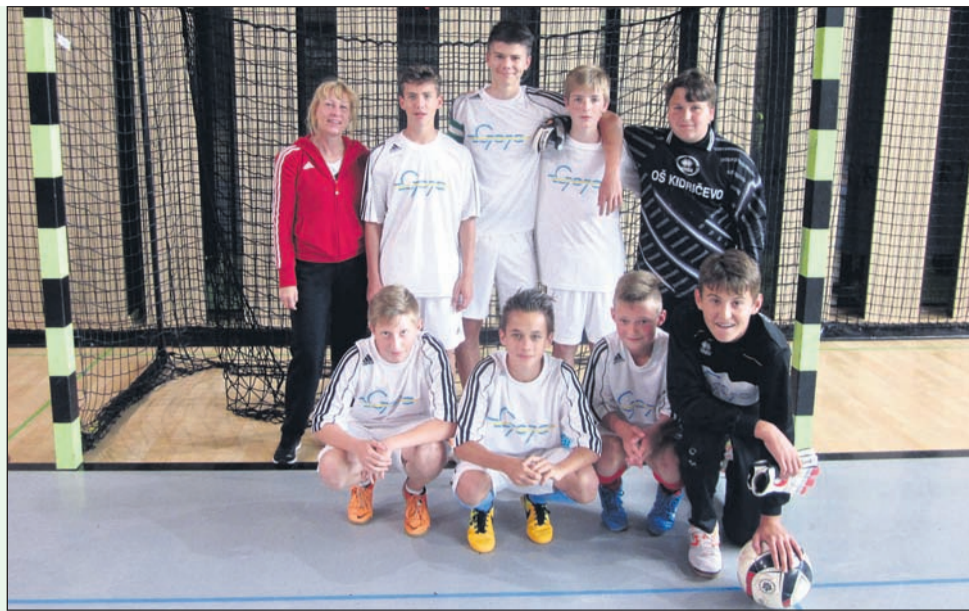
Ekipe OŠ Kidričevo je osvojila 2. mesto na medobčinskem tekmovanju, na območnem pa so ugnali vse tekmece in slavili.

skupina C (ŠD Markovci, 15. 4.): 1. OŠ Videm-Leskovec, 2.