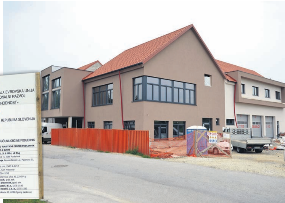
Objekt že dobiva končno podobo, trenutno opravljajo dela na fasadi. V zaključni fazi je tudi ureditev večnamenske dvorane, v kateri je predvidenih 250 sedežev.

Celotna zgradba je zgrajena v energetsko varčni obliki, zato so prepričani, da stroški njenega vzdrževanja ne bodo presegali dosedanjih stroškov vseh objektov, ki so bili do sedaj na različnih lokacijah zunaj središča občine. Kot je zagotovil župan, naj bi bila vsa predvidena gradbena dela končana do konca septembra, po tehničnem prevzemu in vselitvi pa naj bi celoten objekt predali namenu predvidoma v začetku novembra. Pred odprtjem bodo morali zagotoviti še vse potrebno za pridobitev uporabnega dovoljenja in energetske izkaznice, saj želijo objekt odpreti povsem dokončan in z urejeno okolico.