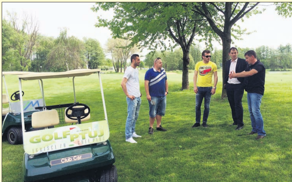
Na Golf igrišču Ptuj so med prvimi v Sloveniji zaznali možnost sinergije golfa in footgolfa.

Pomembno je dejstvo, da footgolferji ne uničujejo trave in da so luknje za footgolf izven greenov (zelenic), kjer so sicer luknje za golf. Footgolf lahko postane pomembna dopolnitev in poživitev igrišč za golf v Sloveniji.