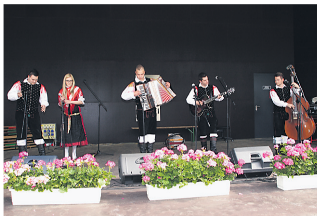
Ansambel Žargon iz Središča ob Dravi