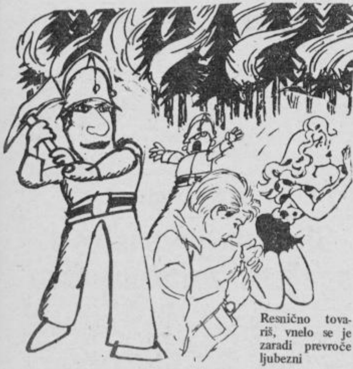
Resnično tovariš, vnelo se je zaradi prevroče ljubezni