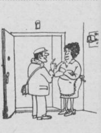
Ne, nismo samo mi elektriki, ki podrazujemo, boste videli kaj bo pri stanarini...