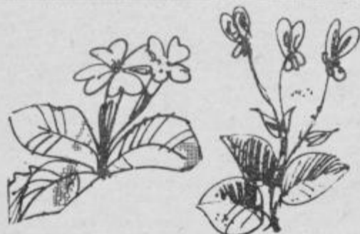
„Fuj, kako smrdljivi sprej uporabljaš“ je rekla trobentica in porumenela od zavisti...