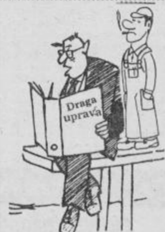
Moram videti, če boste kaj iznašli? — Sem že, delovni čas delavca ni polno izkoriščen!