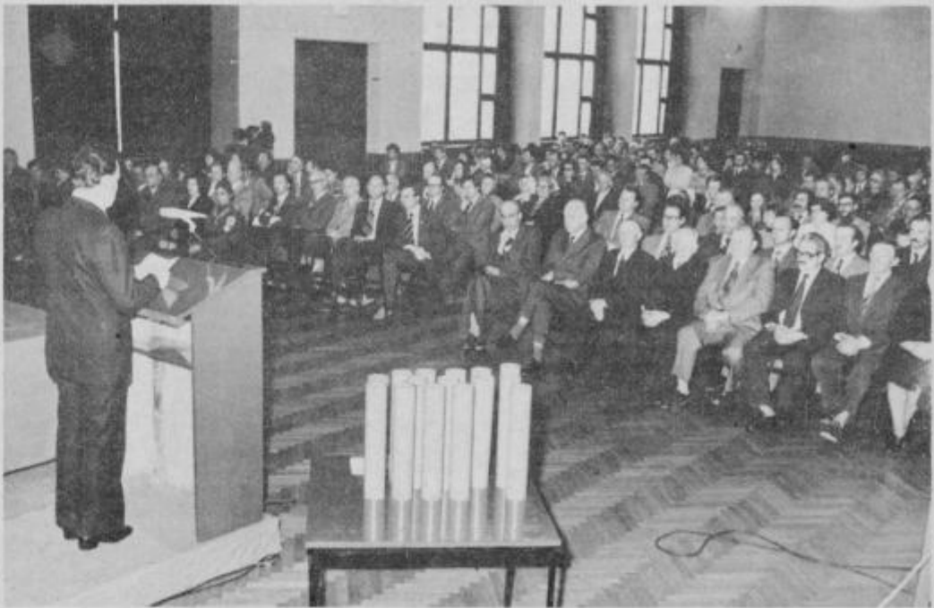
Svečane seje delavskega sveta TGA „Boris Kidrič” in krajevne skupnosti Kidričevo se je udeležilo več sto delavcev, krajanov in predstavnikov občinske skupščine, družbenopolitičnih organizacij in drugih

Ta kratek pregled iz njegovega bogatega dela in življenja nam pove, da je živel kratko, da se je boril dolgo, predano partiji, delavskemu gibanju, revoluciji, izgradnji ljudske oblasti in gospodarstva, da je delal silovito, ustvarjalno, dosledno, da mu je zaupala partija, zaupali so mu delavci, kmetje, mlada, borci. Zaupali so mu vsi, ki