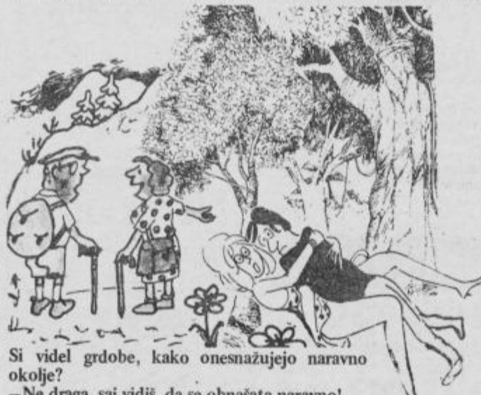
Si videl grdobe, kako onesnažujejo naravno okolje? — Ne draga, saj vidiš, da se obnašata naravno!

Ze dolgo niste nič pomembnega napravili. Ze v tem tednu se vam bo ponudila priložnost, da poboljšate svoj ugled. Če ste že bili pri zdravniku, upoštevajte njegova navodila. Zdravje je samo eno, čuvajte ga. Izognite se neprijetnemu srečanju in odpeljite se na izlet. Kljub slabemu vremenu, bo prijetno. Svetlolaska mnogo misli na vas.