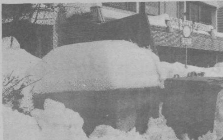
Teh kontejnerjev pred tržnico v Mostah očitno ni potreboval nihče, saj so bili še teden dni po sneženju neodmetani