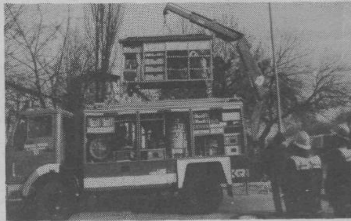
Poklicna Gasilska brigada Ljubljana ima posebno tehnično vozilo, s katerim posreduje, kadar pride do razlitja nevarnih snovi. Za zdaj imajo sicer le dva kontejnerja, enega za razlitje nafte in njenih derivatov, drugega za kislino. Upajo, da bodo v kratkem nabavili še kakšnega. Navzočim so na ploščadi pred Španskimi borci demonstrirali dvigovanje kontejnerja (na sliki) iz vozila, v njem imajo shranjeno vse, kar potrebujejo za pomoč ukrepanje v prometni nesreči (na primer razmikavanje pločevine) in pa prečrpavanje razlitih nevarnih snovi. Prikazali so tudi, kakšna je videti plinotesna obleka in obleka, ki jo uporabljajo gasilci pri razlitju kislina.

občinskem štabu civilne zaščite zagotovili, da mora Komunalno podjetje v tem primeru poskrbeti za prejšnje stanje, nad tem pa bo