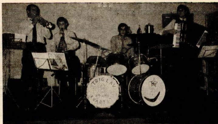
Kvartet "Triglav" iz Sydneya.

nam je vedno priljubljena spremljevalka. Posrečilo se nam je dobiti nekaj plošč in kaset. Ste zainteresirani? Sporočite nam, ker je zaloga omejena. Cene zmerne. Triglav — Sydney.