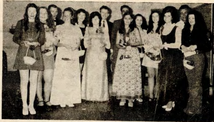
Šopek Slovenskih rož in par "Kaktusov" na pomladnem karnevalu.