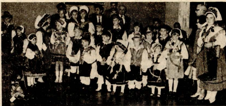
BODOČI VODITELJI "TRIGLAVA"

Vkljub vsem težavam, smo uspešno zaključili prvo finančno leto. Triglavsko življenje je danes odraz slovenske zavednosti in od-