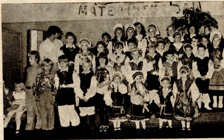
Materinski dan pri Triglavu.

ter nato skupno z drugimi zastopstvi obšla dvorano, da so si mogli vsi navzoči gostje pobliže ogledati posamezne pare. Bilo je nad 1000 ljudi, ki so sedeli ob okusno (v različnih narodnostnih motivih) okrašenih mizah. Vse je bilo zelo lepo in veščanstvo; vsekakor pa so bile narodne noše nekaj najlepšega in najpestrejšega. Vsi so občudovali najini narodni noši in mnogi zastopniki drugih narodnosti so nama čestitali k tako lepi narodni noši."