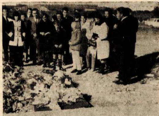
Matušovega Sinčka so pokopali

Zalujoča mamica in atek. (F. in T. Matuš)