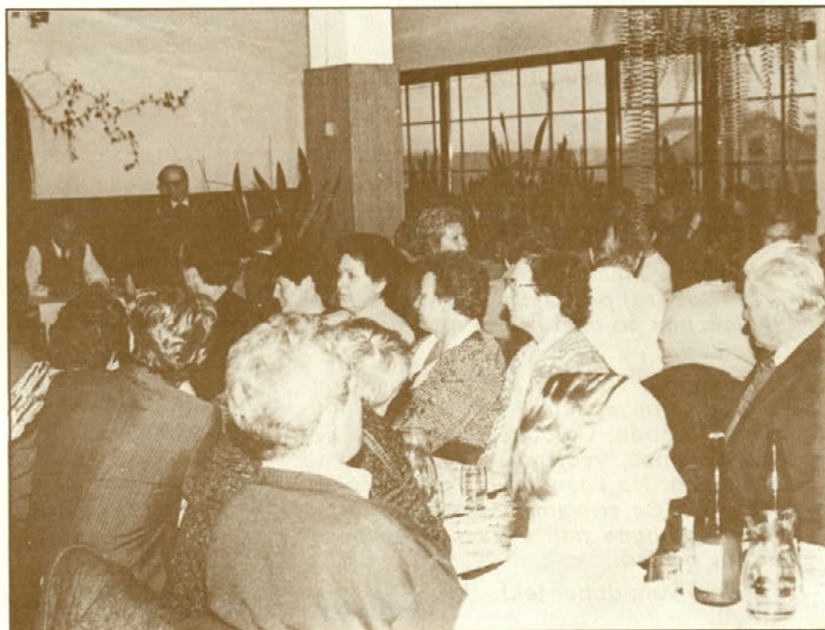
Upokojenci zbrani na letnem občnem zboru poslušajo poročilo o opravljenem delu v letu 1992