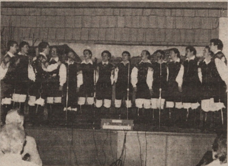
»Fantje na vasi«, Cleveland, so gostovali v Torontu.