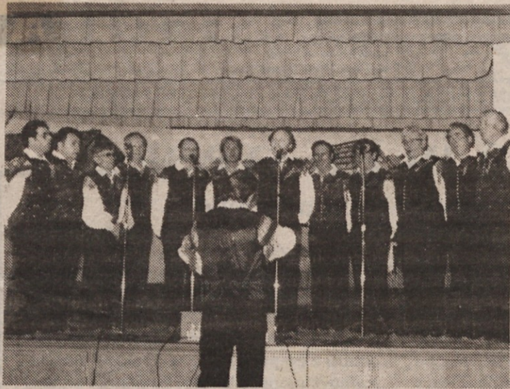
»Fantje na vasi«, Toronto, med koncertom 30. marca.