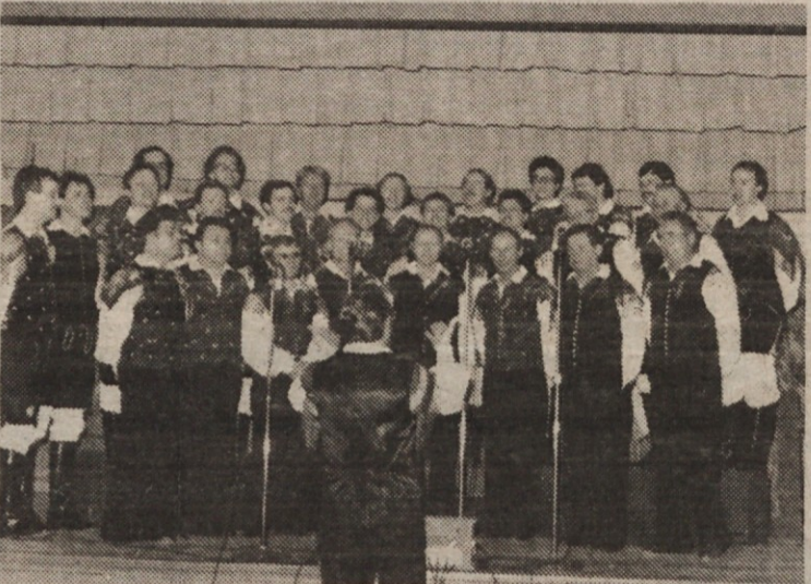
Skupen nastop zborov »Fantov na vasi« v Torontu.

CLEVELAND, O. — Prostorna cerkvena dvorana Brezmadežne na Brown's Line v Torontu je bila v soboto, 30. marca, zvečer do kraja zasedena. Občinstvo je z burnim ploskanjem, ki se je stopnjevalo od pesmi do pesmi, dajalo priznanje ubranemu petju. Domača slovenska pesem je ustvarila živahno razpoloženje. Res veselo je bilo med kanadskimi Slovenci v Torontu!