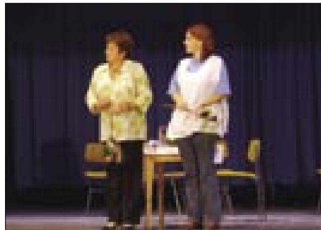
Članici gledališke družine Nindrik-indrik

Območna izpostava (kirendeltség) Lenart Javnoga sklada za kulturno delo v Ljubljani (Kulturális Közalapítvány) je letos pripravila že 10. mednarodni lutkovni festival. Letošnji festival je držo osem dni, med 8. pa 28. septembrom, gda so se vsevküper zašpilale trinajst lutkovne igre pa dvej gledališki igri. Gda smo na Slovenskoj zvezi dobili pozvanje od vodje OI JSKD Lenart Brede Rakuša Slavinec, smo obadvej gledališke skupine