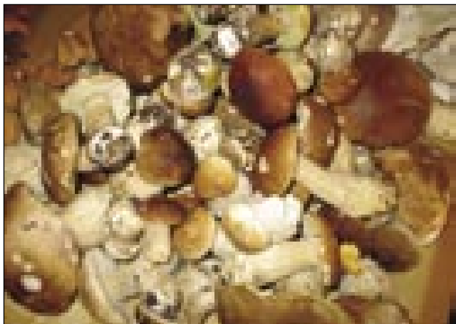
Telko grbanjov smo najšli!

bi avtobus nej zavole mesta emo. Skor smo tak trüdni gratali, kak lik bi na Triglav splezdili. Gda smo prišli do staroga rama, šteri ma gospodarico v Merki, so nas Andovčani čakali z žmanov domanjov palinkov. Čako nas je eden konj s kaulami tó, na šteraj so bile tikvi pa kukarca. (V Andovci prej samo toga ednoga konja majo.) Stari poznanci so se z veseldjom srečali.