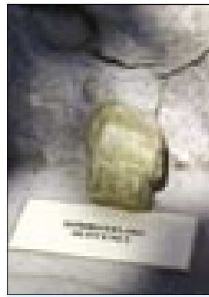
Kamen iz Perinta

rejsan varaška deca. Telko titi po lesej, pravo pa lejvo, v blato pa prejk, nejsem trn lado. Pomalek smo prišli do slovenske grajnca, te sem že vüpanje emo, ka de na kraci konec. Pa tak tó bilau. Tri vöre smo ojdlj, pa sem ge samo eden grbanj najšo. Na, ka nemo vsigder o sebi gučo: drugi so pune žačke gob meli, tak ka se nej trbólo bodjati za večerdjo.