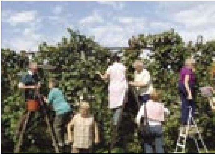
Flajsne ženske roke so brž pobrale grauzdje

Drüštvo porabski slovenski s kangli tü, moški pa dola mle- penzionistov zvöjn velki prog- ti. Pauv je pa bijo trno lejpi pa