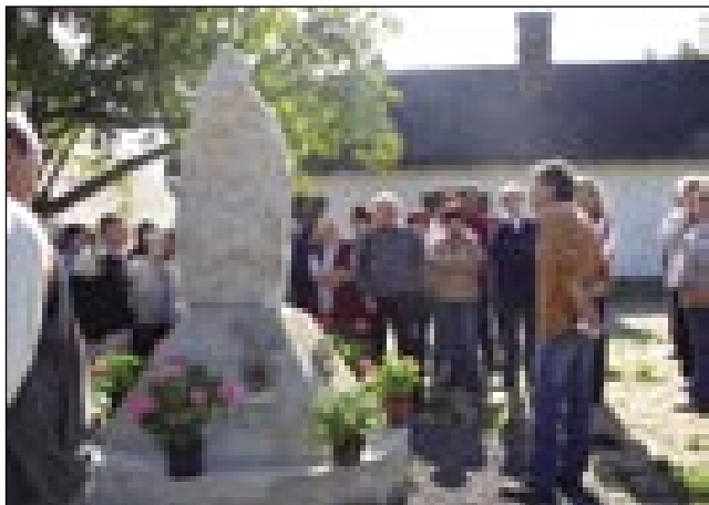
Sombotelčani pri andovskom Triglavu

tau, ka na Vogrskom tó živejo Slovenci, šteri bi radi svoj sveti brejg meli. Pejški smo mogli oditi po andovski poštiji, vejpa