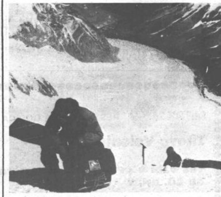
Počitek Ivča Kotnika ob nahrbtniku na katerem je tudi nalepka Našega časa