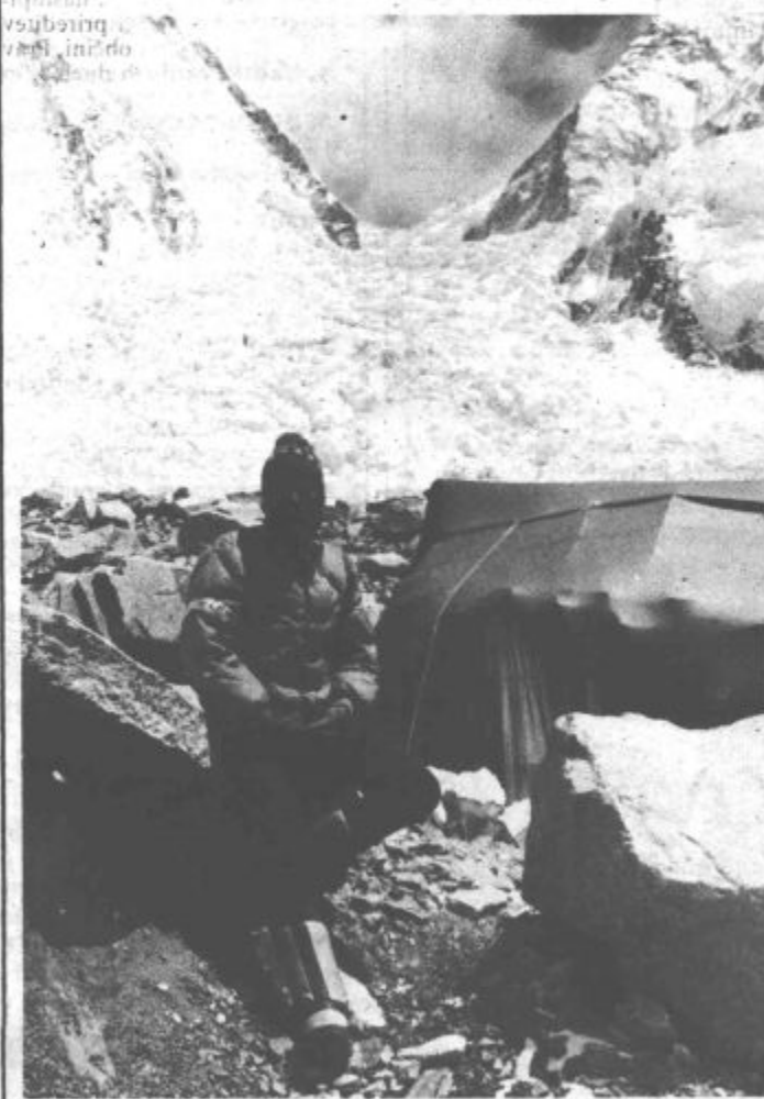
Avtor članka na eni od svojih poti

Najvišji v skupini je 4875 metrov visoki Semjon Tjanšanski, najmočnejši pa sta 4860 me-