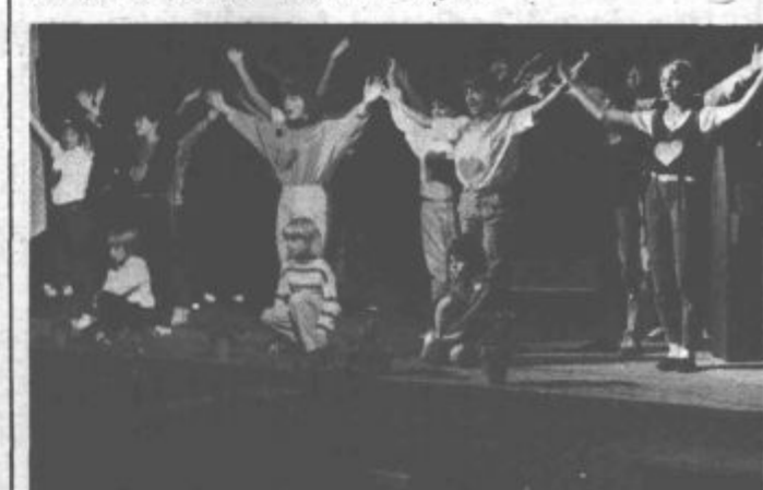
Najmlajši člani med nastopom