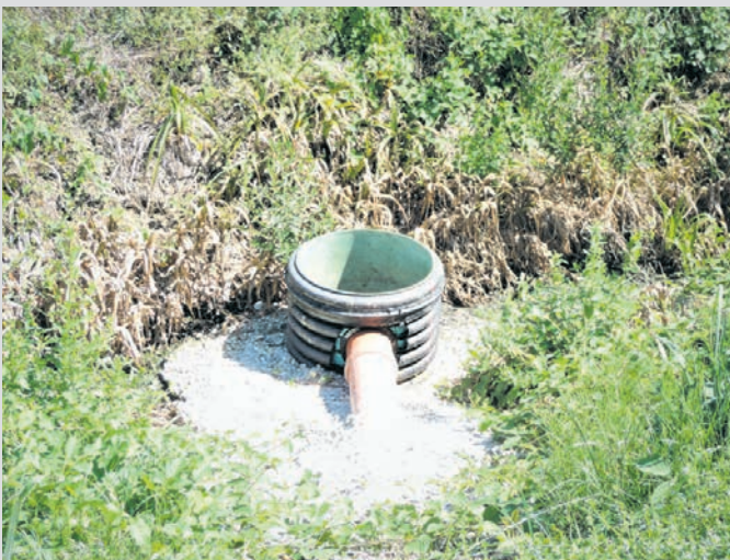
Rastline ob iztoku čistilne naprave se sušijo, ker naj bi neznani storilec brežino potoka poškrupil z nevarnim škropivom glifosata.