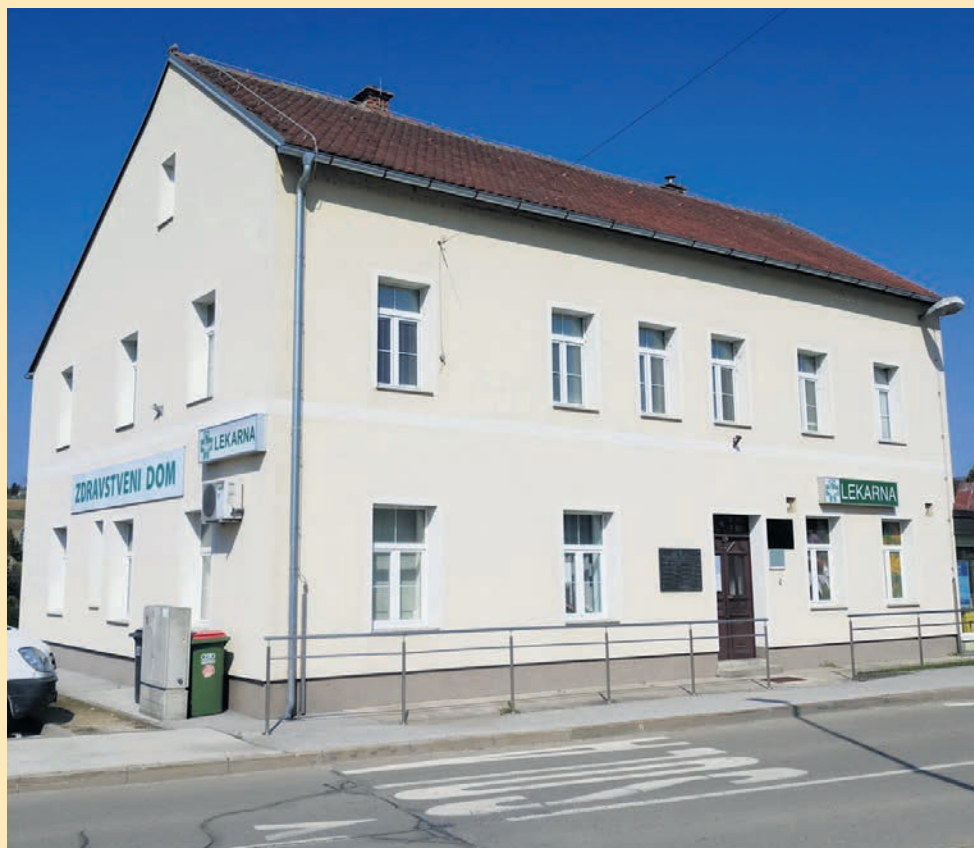
Bodo v Juršincih ostali brez svojega zdravnika?

Lasbaherjeva odpoved koncesije znova odpira tudi vprašanje zanimanja za družinsko medicino. »Potrebujemo povsem spremenjen zdravstveni koncept in odnos do družinske medicine, ki je v tem trenutku slab. Med mladimi ni zanimanja za to specializacijo, potem je pa tu še podeželje, kamor tudi nočejo, čeprav je delo zdravnika prav na podeželju, kjer si dejansko družinski zdravnik, lahko zelo lepo in učinkovito. Ljudje v Juršincih si zaslužijo dobro urejeno ambulanto in stalnega zdravnika, ne pa 'flikanje' z nadomestnimi, ki jih bodo 'kazensko' pošiljali iz Zdravstvenega doma Ptuj. Zato je zelo pomembno, da v naši ambulanti ostane čim več vpisanih, ker se bo tako Občina Juršinci lažje pogajala za stalnega zdravnika. Ker je trenutna zakonodaja takšna, da ni mogoče dobiti nove koncesije, si za svojo ambulanto res želim najti zdravnika, ki bo v njej za polni delovni čas in plačo, sam pa bom šel do upokojitve čez sedem let na 'minimalca'. Če mi ne bo uspelo, bom pač šel med svobodnjake in do penzije nadomeščal druge zdravnike, seveda pa delal veliko manj kot do sedaj.«