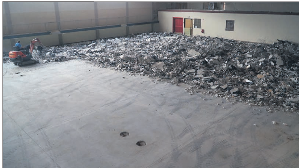
V dvorani na Hardeku trenutno potekajo dela, povezana s pripravo tal.

Kar pomeni, da bodo ormoški rokometaši še četrte priprave zapored, dvojne poletne in dvojne zimske, opravili izven trdnjave Hard Ek. »Ni druge, moramo se sprizniti s tem. Priprave bomo pač oddelali pri Veliki Nedelji. V klubu se veselimo, da dela počasi prihajajo h koncu in da se bodo vse naše selekcije vrstile na novi domači parket. Verjamemo, da bo tudi krivulja rezultatov na domačem terenu znova šla proti vrhu in da bodo predvsem mlajše selekcije znova številnejše. Zdaj nas ni treba biti strah, da prva domača tekma proti Izoli ne bi bila odigrana v Ormožu. V 2. krogu, ki bo na sporedu v soboto, 14. septembra, bo naša trdnjava zagotovo