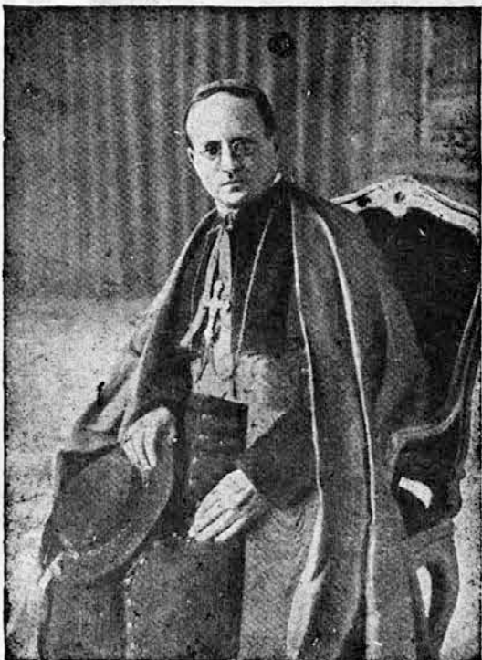
Sv. oče Pij XI. (1922-1939), ki je sklenil konkordat med sv. Stolico in ital. državo.

Letos je dne 11. februarja poteklo 30 let, odkar je bil podpisan konkordat med italijansko vlado in sv. Stolico ali tako zvan Lateranski pakt. Po vsej državi so se tega spomnili z večjimi ali manjšimi slovesnostmi, v šoli so šolske oblasti odredile, naj se dijakom pojasni pomen te obletnice. Vatikansko glasilo »Osservatore Romano« je prineslo dva pomenljiva članka o tem dogodku in sicer najprej govor, ki ga je imel sedanji papež Janez XXIII., ko je bil še kardinal v Benetkah, in pa govor, ki ga je pripravil leta 1939 papež Pij XI. za prvo desetletnico konkordata, a ga ni mogel prebrati, ker je ravno na predvečer umrl. Oba ta članka nam povesta bolj kot beseda kajere koli druge osebe, kaj je bilo in kaj je Lateranski pakt za sv. Cerkev in za Italijo.