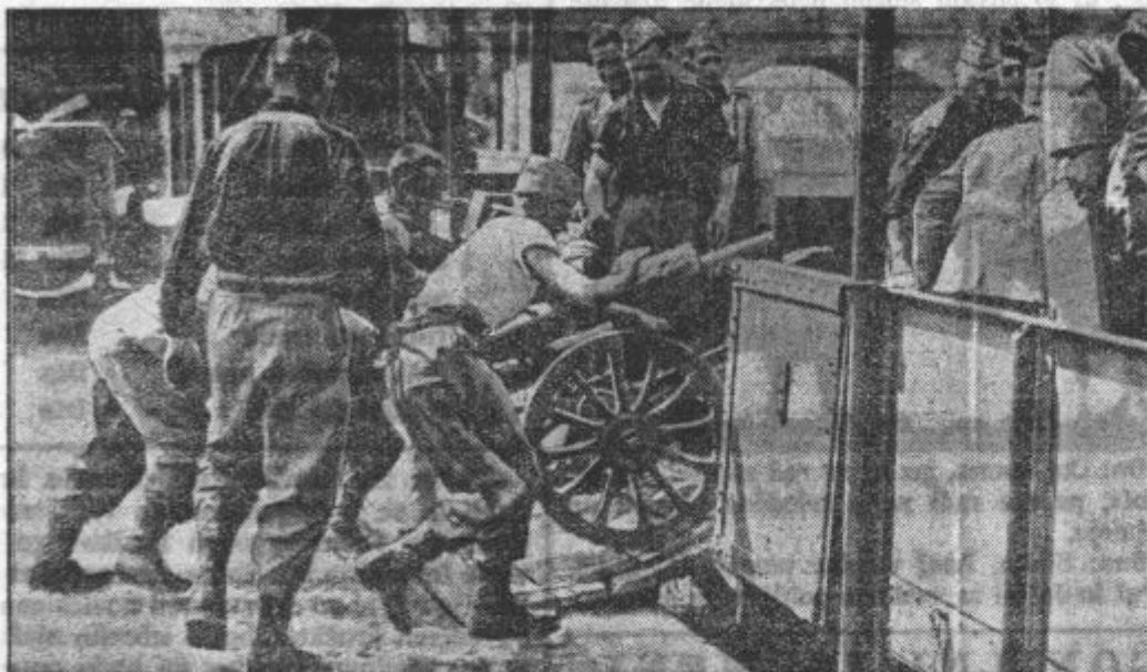
Italijanski vojaki pri tovarjenju artilerije namenjene za vojsko z Abesinijo