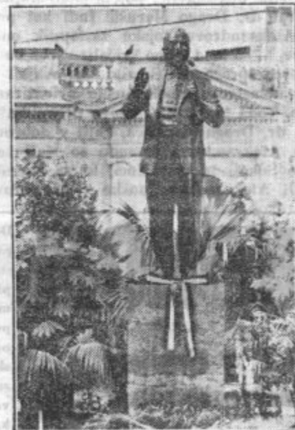
Prvi spomenik, ki so ga postavili kmetje Stjepanu Radiću je bil odkrit te dni na Radićevem trgu v Petrinji.