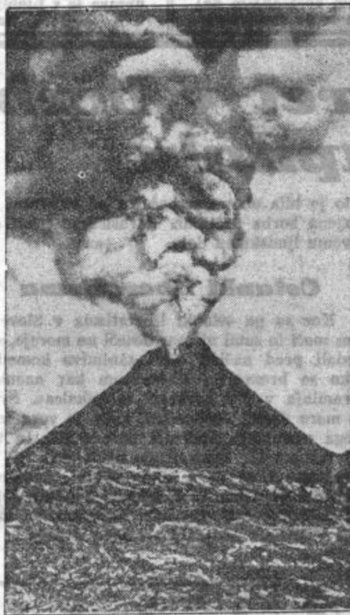
Vezuv zopet bruha lavo. Eden od največjih ognjenikov v Evropi Vezuv, ki leži ob morju

sobnosti, sama težkim nalogam ne bo kos. Zato potrebuje dosti dobrih prijateljev, pomočnikov in podpornikov, dosti, dosti resnično dobronamernih političnih vzgojiteljev naroda. Kajti, če narod ne bo dobro politično vzgojen, v vseh situacijah pameten, discipliniran in zvest, ne bo uspehov, pa če bi vlada sama delala čudeže. Narod vzgajati, duhovno voditi in mu kazati v teh težkih časih pravo pot pa je v prvi vrsti poklicano dnevno časopisje. Pif, Paf, Pof, trojke, petorke, sedemletke, rekriminacije in žalitve pač niso sredstva za pomirjenje in ne kažejo resne volje za pripravo boljših časov in narod takim nikoli ne bo verjel. Zato še enkrat: spametujte se!