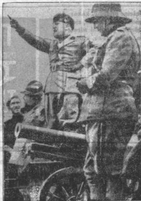
Bojeviti Mussolini govori črnosrajčnikom ter jih bodri za vojsko proti Abesincem.

Pri tem navdušeni oznanjevalci svobode nič ne pomislijo, da bi marsikak evropski svobodnjak rad zamenjal svojo žalostno vlogo za položaj dostojnega sužnja. To zveni sicer nekoliko odurno, je pa resnično.