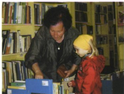
Redna pot iz igralnice vodi v izposojevalnico.

oblike dela, ki jih namenjamo svojim mladim uporabnikom.