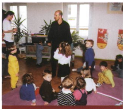
Pravljlična soba – prostor najrazličnejših doživetij (foto Maja Logar, Pionirska knjižnica Rotovž, 1999).

z nasveti in izkušnjami pri izboru tudi ustvarjalno usmerjajo. Pri pripravi srečanj smo upoštevali splošna pedagoška načela, pomembna za otrokov vsestranski razvoj, hkrati pa smo jim skozi igro bližali knjigo in knjižnico.