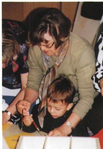
Vnuk in babica skupno ustvarjata.

Delo z najmlajšimi v igralnici nadaljujemo z izkušnjami, ki smo si jih v tem času pridobili, in z oblikami, ki združujejo igro, umetnostno, književno, knjižno in knjižnično vzgojo. Izhajamo iz knjige, pri izbiri književnih besedil ter vsebin iz strokovnih publikacij za otroke sledimo primernosti besedil in tem za ciljno starostno skupino. Odločamo se za dela slovenskih in tujih avtorjev ter pogosto vključujemo tudi fond dragocene arhivske zbirke, v kateri sistematično zbiramo kakovostne slovenske in predvsem tujejezične slikanice za razvijanje in izvajanje različnih oblik dela z mladimi bralci. Hkrati je del arhivske zbirke tudi pester izbor oblikovno in vsebinsko zanimivih knjig za potrebe igralnice. Na Rotovžu to gradivo redno nameščamo v predalčnike v sredini pravljíčne mize, da je obiskovalcem vedno na voljo. V času druženja otroci pogosto in radi posegajo po knjigah, med katerimi se znajdejo od najmanjše do največje, take, ki so uganke, ki presenečajo z lesenimi platnicami ali