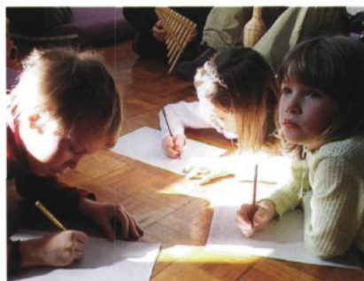
Pravljice spodbujajo likovno ustvarjanje otrok (foto Robert Kereži in Metka Narath, Pionirska knjižnica Rotovž, 2003).