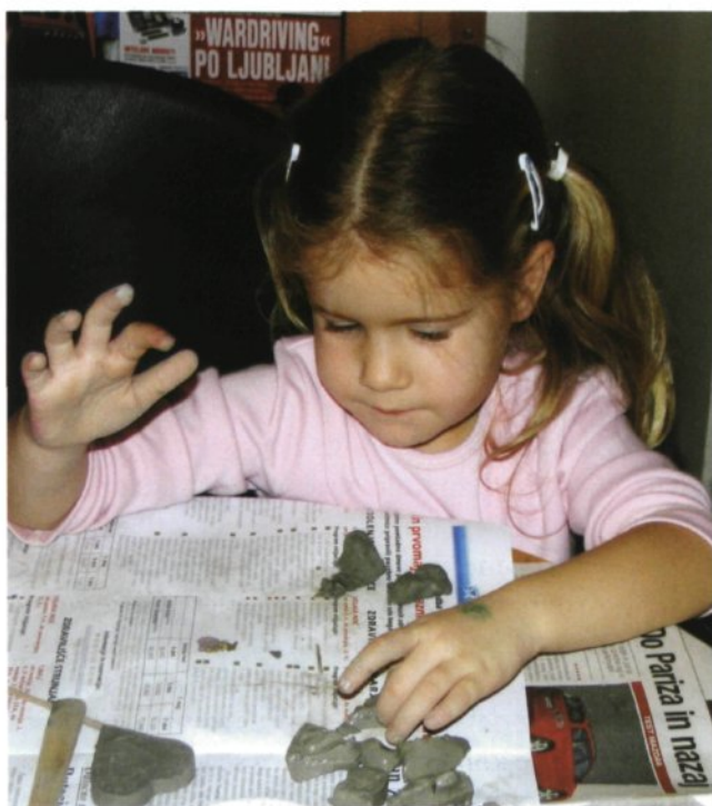
V glino preneseno doživetje pravljice.

Igroteka v Pionirski knjižnici Nova vas nam nudi možnost, da si zagotovimo vsaj tri pestre kolekcije na leto, s čimer lahko obiskovalcem igralnic omogočimo široko ponudbo gradiva. Za igralnico odberemo predvsem igrače iz naravnih materialov, zaradi dovolj prostorne pravljčne sobe pa si lahko privoščimo tudi velike lesene hiše, sestavljanke, drobno pohištvo, nepogrešljive lutke ter celo vrsto ustvarjalnih in družab-