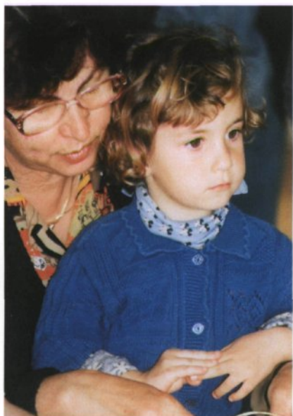
V babičinem naročju je doživljanje prijetnejše.

odstirajo zgodbo mehke tkanine in otroke vabijo h knjižnim igram.