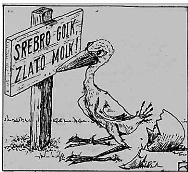
Bruc (Mukolovecky, Križevački statuti. Maribor, 1928).

Pri krokarskem omizju morajo vsi krokarji piti isto pijačo, kdor se pravilom ne pokorava, je za tisti večer izločen iz omizja. Po Križevačkih statutih sta edini dovoljeni krokarski pijači pivo in vino, ki je lahko različnega porekla. Za vodenje krokarskega omizja je vsakič izvoljena nova »stara hiša«, ki ga s posebno pesmijo povzdignejo v »stoloravnatelj« ali »Zelenega Carja« in ga »dva mišično nadarjena bruca« 25 na ramah odnese na častno mesto. Zeleni Car »ima neomejeno oblast nad vsem omizjem« in je v vseh krokarskih zadevah nezmotljiv, zato ga je treba cel večer brezpogojno ubogati. Njemu na čast se pije vsaka tretja zdravica. Če je krokarsko omizje večje, je Zelenemu Carju pri vodenju dovoljeno po posebnem protokolu izbrati pomagače, ki jih predstavljajo: Kontrapikuš (desna roka Zelenega carja, ki lahko kaznuje bruce), Fiškuš (skrbi, da nihče nima prazne čaše in da se pravila Križevačkih statutov dosledno upoštevajo in izvajajo), Vunbacitelj (v primeru neupoštevanja pravil odstrani upornega krokarja), Pevovoj ali kantušminister (vodi krokarsko petje) in Klobasar (glavni govornik v krokarski družbi, humorist). 26