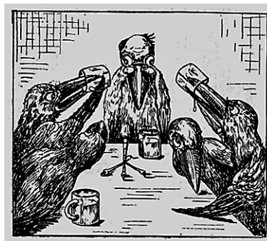
Pije se butelj! (Mukolovecky, Križevački statuti. Maribor, 1928).

Krokarski prepiri se rešujejo častno, »s pošteno krokarsko pijačo«. Kdor se počuti razžaljenega, navesi sokrokarju t. i. »butlja« tako, da pred celim omizjem glasno zakriči »butelj« in žalivca izzove na krokarski dvboj. Če se krokarski ne čuti zmožnega udeležiti se dvo-boja, lahko imenuje svojega namestnika, v nasprotnem primeru ostane butelj nerešen do naslednjega krokanja. Vsak butelj se mora izpiti v teku 10 krokarskih minut (8 navadnih minut). Stranki si v enaki meri do vrha napolnita čaši, nato na povelje nepristranskega razsodnika izpijeta do dna. 29 Seveda se nepristranski lahko zmoti, zato je na voljo »zadnja instanca v krokarskih zadevah« – krokarski sod, ki sestoji iz treh starih hiš ali krokarjev. Sklic le-tega pa terja svoje stroške, ki se delijo na tožnika in zatoženca v razmerju, ki ga določi sod, ne glede na razsodbo samo.