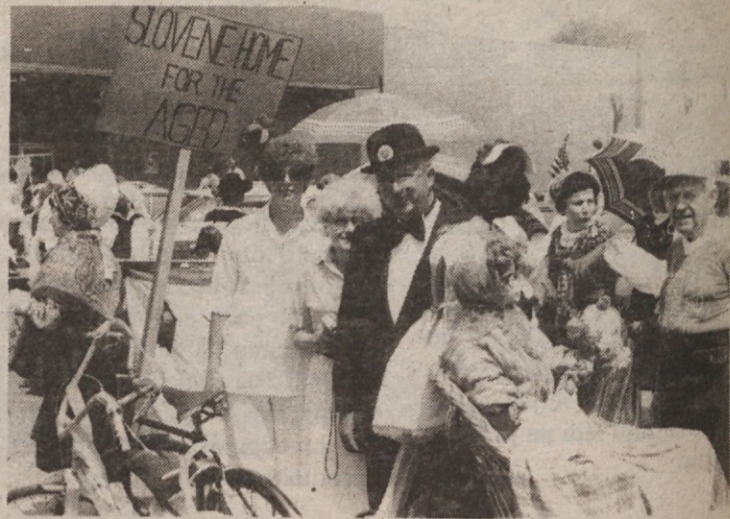
Malo za šalo, malo zares!

vnučni in nečakinje. Cleveland, 26. avg. 1983.