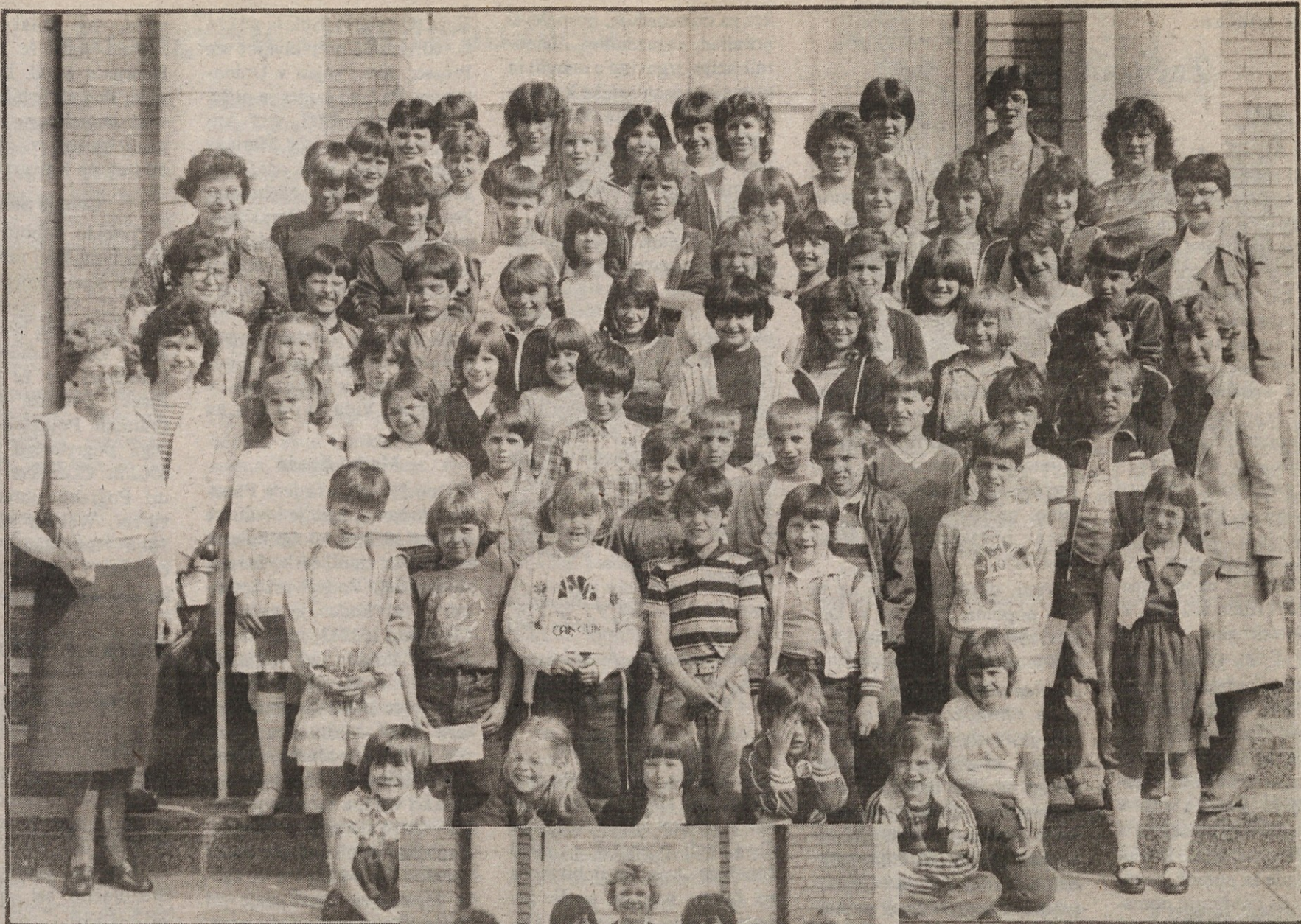
Zgoraj: Slovenska šola pri Sv. Vidu, Cleveland, Ohio, z učiteljicami