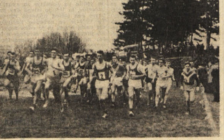
Start članov na 7500 m dolgi progi