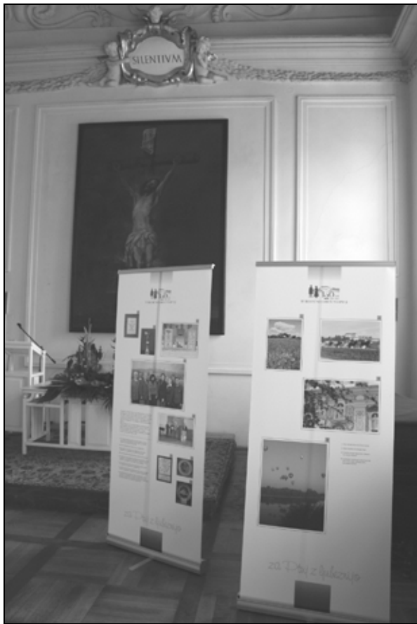
Z razstave Turističnega društva v refektoriju minoritskega samostana na Ptuj, junij 2006

urejen videz mesta, njegove okolice ter dobro počutje obiskovalcev.