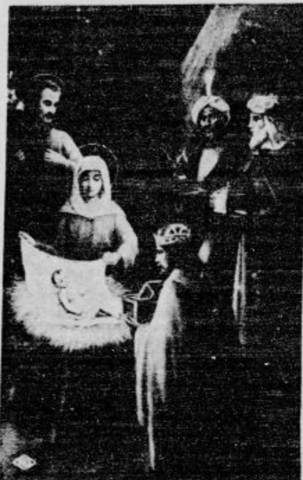
Kako je bila tišina Kristusovega prihoda bolj kot njegova poznejša javna dela: ozdravljenje bolnikov, obujanje mrtvih. Pred to tišino se v ponižnosti sklonimo, v tej ponižni tišini ga molimo. In ko se bo dopolnil njegov čas, se bo zopet zavil v tišino, v tišino ponižanja in zasramovanja in bo izginil v tišino smrti in groba. Od vseh Kristusovih del se mi zdita največji tišina svete in tišina smrtni noči.

brezmiselna beseda v širokem krogu utone brez posledic, v ozjem krogu pa boli; v ozjem duhu Kristusovem: bratovščino božjega miru in sprave? Če bi ustanovili celice miru, negovali željo po miru v najozjem krogu? Včasih živimo v ozkem krogu teže, kot na v širšem: