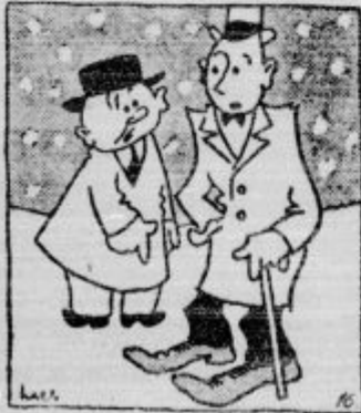
»Ali boš res kupil senučke? Minimal, da jih pri takih čevljih nič ne potrebuješ.«

d Okrog 3000 madjarskih državljanov, ki niso imeli dovoljenja za bivanje v naši državi, ali ki jim je potekel rok za dovoljenje bivanja, so naše oblasti izgnale na Madjarsko. To je samo ena desetina madjarskih državljanov,