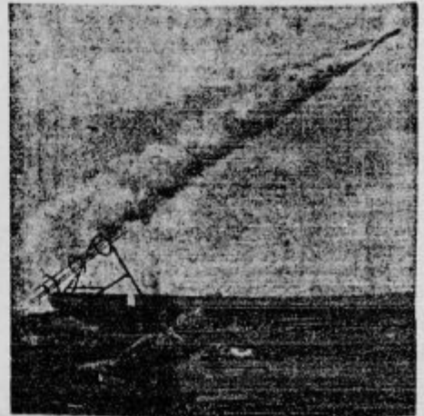
Delajo poskuse, da bi v raketi pošiljali pošto čez morje iz Anglije v Francijo

d Usoda policijskega stražnika. Na sveti večer zjutraj je na železniški progi poleg Zemunna pri mostu vršil službo policijski stražnik