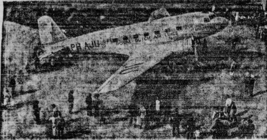
Veliko holandsko letalo je 20. decembra strmoglavilo na tla v asirski puščavi in se pri padcu vnelo. Vseh 7 potnikov je z letalom vred zgorelo.

odborov odšli vsi na Oplenac, kjer so se poklonili spononu kralja Aleksandra I.