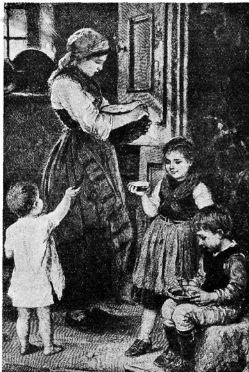
Še meni kruhka!

Za vzgojo dečkovo se starši resno zanimajo. Veseli jih, če vidijo, da so otroci ponosni in samozavestni. Dobe se celo matere, ki so pripravljene služiti pobčem kot pokorne služabnice. Oblačijo jih, čevlje jim snažijo itd., čeprav bi dečki že sami lahko vršili podobna dela. Lažje prenašajo fantičevo razposajenost, jezo in oblastnost: on bo pač enkrat mož, bo šel v svet in zavzel vodilno mesto v družini. Zato matere dečkom marsikaj prezrejo in celo skrivajo njih razposajenost pred strogim očetom. Deklico — no ja, deklico imajo pa matere za igračko, punčko. Lepo