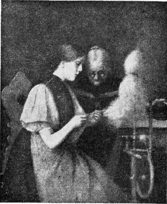
Mati in hči.

V društvih se popoldne s primernim programom proslavi ta praznik ob navzočnosti mater in otrok.