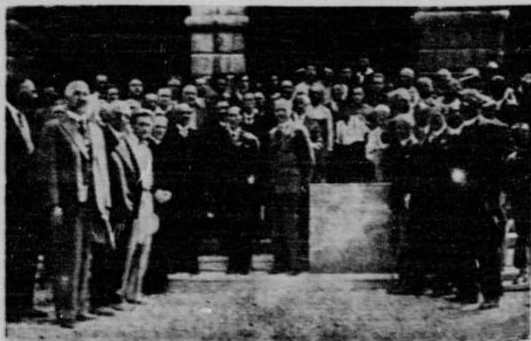
Spomenik kralja Petra boje odkriti v Ljubljani pred ročevjem v nedeljo, 6. septembra. Podstavek za spomenik so že položili. Voznj se vidali 25. julija spominske listine. Na ulici vidimo imenitne osebnosti, ki se prisostvovala polaganju temelja.