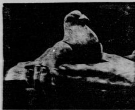
Posetni grinih, ki je zmagnal na veliki tekmi Harwachi-Berlin. Zmagnal je razdalje 850 km v 42 urah. Imel je povprečno hitrost 200 km na uro, kar za grinih ni kaničobi.