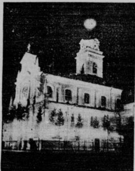
Cerkev Marije Pomotnice na Brezjah je bila v soboto zvečer ob priliki rimske procesije krasno razsvetljena.