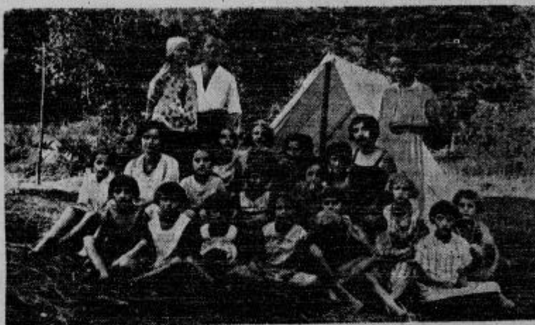
Mladina na selcu in zraku. Borei Krekove mladine taborijo pod šotiri v Martuljku. So večinoma zraka potrebni delavski otroci. Slika predstavlja skupino deklice z vodstvom.

SCHICHTOV RADION PERE SAM IN VARUJE PERILO ZAJAMČENO BREZ KLORA