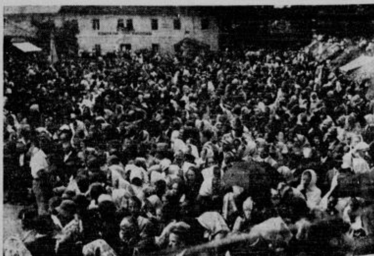
Pogled na množice, ki so bile na zborovanju Kat. akcije na Brezjah.