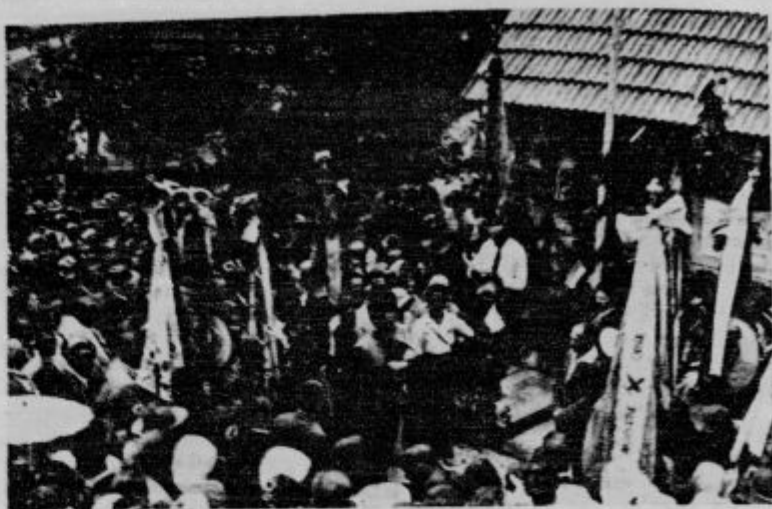
Poljed na množice, zbrane na proslavi 100 letnice Levstikovega rojstva pred mislivo rojstno žari.