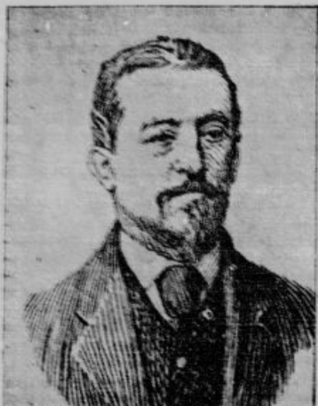
Franck Levstik, slovenski pisatelj. Čigar 100 letnico rojstva obhajamo letos. V nedeljo so se v Vel. Laškah, rojstni žari pisateljeva, vršile v ta namen velike svečanosti, ki jim je prisostvovala tisočglava množica.