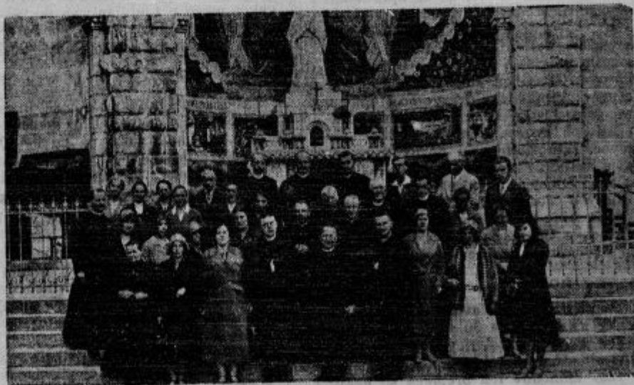
Slovenski romarji so tudi letos obiskali božjo pot v Lurdu. Mimogrede so obiskali tudi grobova Male Cvetke in sv. Janeza Vijaneja in glavno mesto Francije: Pariz.

»Čemu pa ste vzeli takega blagajnika? Saj je kruljav, škili, ima kriv nos in ušesa mu proč stoje.« »Zato, da ga bo lahko hitro dobiti, če pobegne z blagajno.«