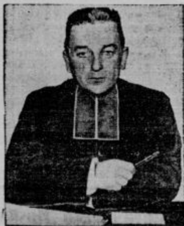
Alzacki poslanec abbe Wetterle, ki je te dni umrl. Pokojnik je bil za časa nemškega režima v Alzaciji neupogljiv branitelj francoskih narodnih pravic, ki jih je do leta 1914 zastopal tudi v nemškem državnem zboru.