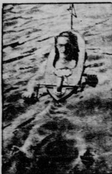
Najmanjši čoln z vsjakom in njegov iznajditelj. Ladnja je 1 m dolga in približno 10 funtov težka. Morski vojniki bi se v njej seveda ne ubraali.