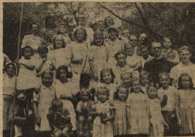
Un grupo de alegres excursionistas en la estancia San Juan. Nekaj otroških obrazov.

O tem papežu pravi zgodovinar Hergenroether: "Bil je mož jasnega razuma, odličen kot državnik ter zakonodajalec in spreten v urejevanju cerkvenih zadev. Razvil je izredno delavnost v velikih zmedah svoje dobe, delal je neumorno za spreobrnjenje nevernikov, za vzdrževanje discipline in za reševanje dežel, zasedenih po Saraceni."