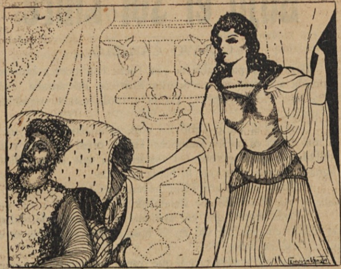
ALANKA PENETRO EN LA TIENDA

Iztok conocía a su raza, su sangre. Unos días después de la vuelta de Iztok, había llegado al castillo la noticia de