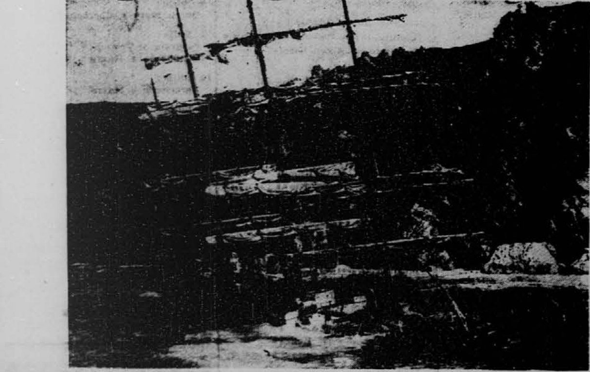
Na sliki vidimo veliko jadrnico "Herzogin Cecilie", ki je v gosti megli naselila na čeri ob angleški obali. Ladje niso mogli rešiti in se bo razbila ob skalah. Finski pomorščaki so z njo vozili žito in so s hitrostjo osemkrat premagali druge jadrnice.