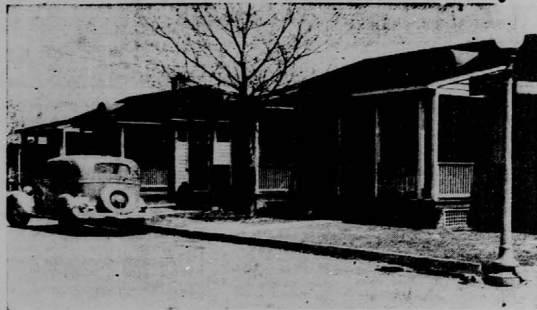
Blizu reke Potomac, nedaleč od kapitola v Washington, D. C., je letos družba Welfare and Recreation zgradila cele ulice majhnih hiš za prenočišče tujcev, ki obiskujejo Washington.

HIŠE ZA TURISTE. BLIZU WASHINGTONA, D. C.