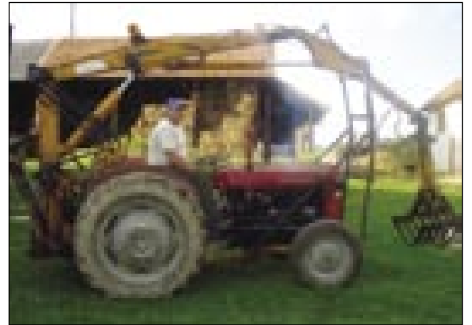
Eden od štiri traktorov

prajti, te se ti splača delati, ovak pa nej. Stara mašinerija je takšna. Nauvi traktor se pa ne splača, zato ka so pri nas male kmetije.«