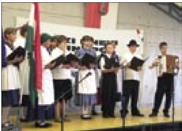
Mlašeči pevski zbor

soboto, pa zadvečerka je že začnilo deževati. Šlau je cejli večer, cejlo nauč, pa zrankma, gda smo se parbidili, eške itak nej enjalo. Brodili smo si, ka kak mo zdaj vaški den držali? V 10. vōri se je začnila sveta meša. Gda smo lidgē šli k meši, eške itak oblačno bilau, depa dež je stano.