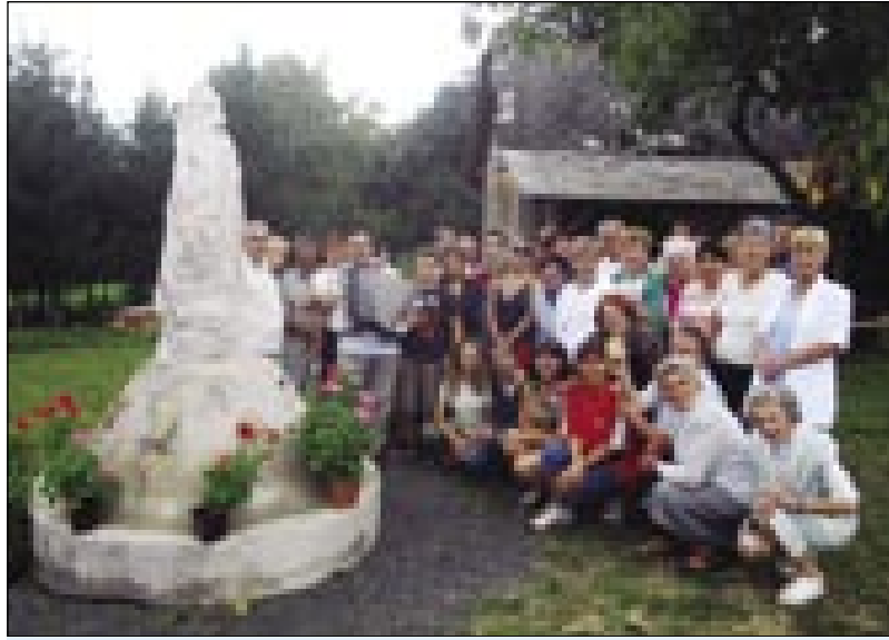
Budimpeštanski Slovenci so tō prinesli svoj kamen k »Malomi Triglavu«

Letos smo meli Porabski Slovenci že ausmo državno srečanje, stero je v tom leti organizirala v Monoštri Državna slovenska samouprava.