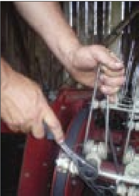
Nej samo dobre roke, liki pamet tō moraš meti za tau delo

ja se več ne razmej ali se neške razmeti k tauma. Sto šké zamazane, oljnate roke meti,