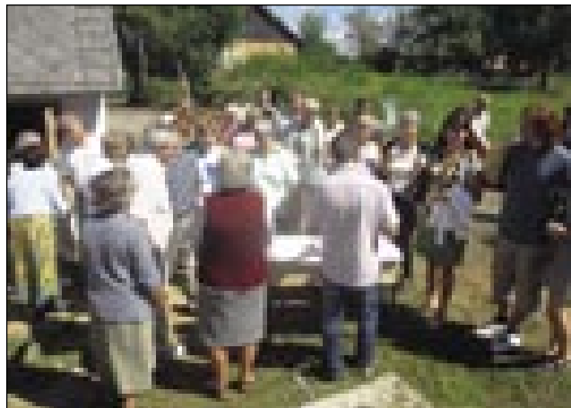
Domanji so je ponidili z domanjo palinko

gram, tak je bilau zdaj tō. Vsikšoma so se trno vidli mladi muzikantje (Mariborski