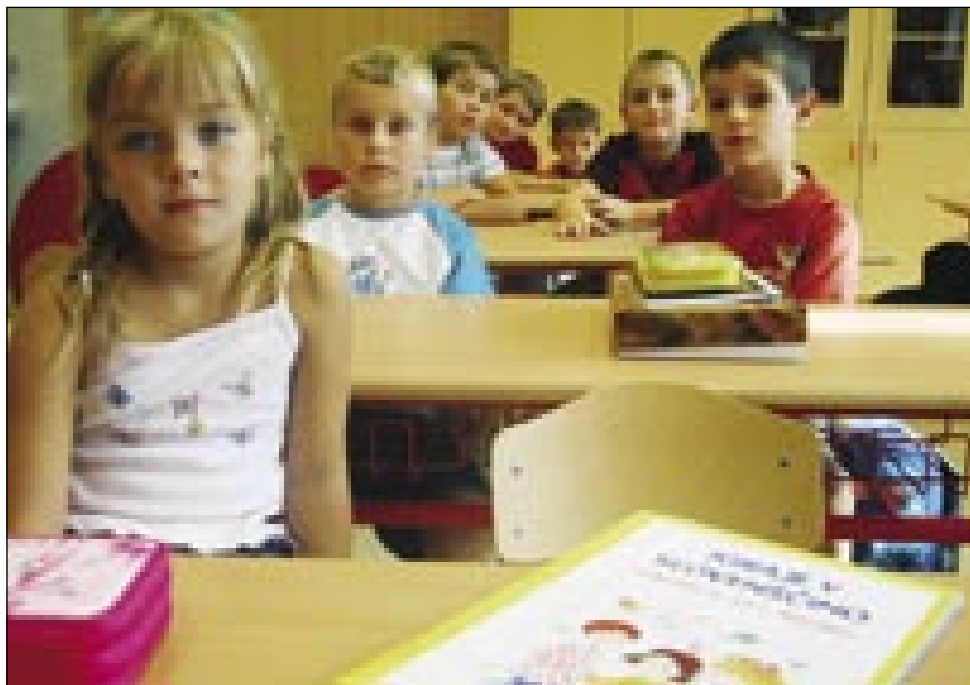
En tau gorenjesenički prvošolčkov

Dapa lejpi dnevov je konec, mlajši so več ali menje napunili šaule pa vrtce. V Porabji je tau najvejša baja, ka raj menje. Tau najbolje vala za vrtce, gde