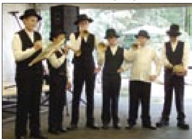
Mali senički muzikantje

Na konec programa je že podnek grato, pa je seniška občina vsakšoga pozvala v šotori na obed, na grajovi golaž. Cejli zadvečarak so bile na šolskom dvorišči špile za mlajše. Biu je gospaud, šteri je delo razne figure iz balona, bile so ženske, štere so vōnamalale lice pa roke, za starejše pa so brezplačno mejrili krvni pritisk pa cukar. Potistom od 4. do 7. vōre sta bili dve tekmi. Najprva so se špilali seniški stari podje pa Martinjčarge. Tū so zmagali gostje. Na drugom derbiju pa so špilali mladi, Srebrni brejg pa Slovenska ves. Tūj so pa s sedemmetrovkami zmagali naši podje. Po tekma so lidge spet leko geli večerjo v šotori. Biu je divjačinski pörkölt. Od 7. vōre dale je bila veselica, gde je špilo Adam pa sin. Med veselico sta prišla plesalca, šteriva sta