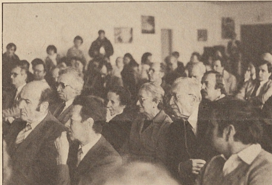
Občinstvo je z zanimanjem poslušalo predavanja.