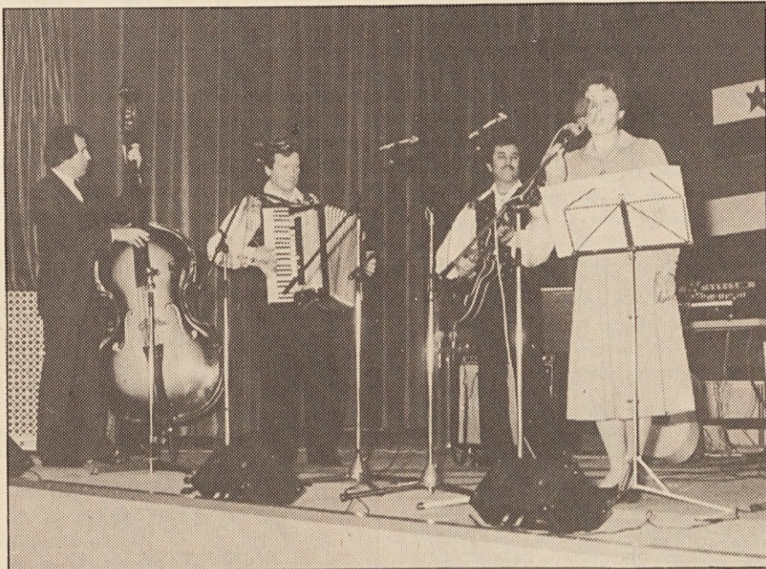
»Prvi« trio »Korotan« je v nedeljo po dolgem času spet nastopil.

ustanovitve. Zato je povabil k praznovanju in sodelovanju instrumentalne skupine iz našega ozemlja. Prišli so »Mladi mi« iz Celovca, »Korenika« iz Šmihela, ansambel »Drava« iz Borovelj, trio »Korotan« v treh zasedbah in novi društveni ansambel »Zmeda«. Ljubitelji instrumentalne glasbe in prijatelji