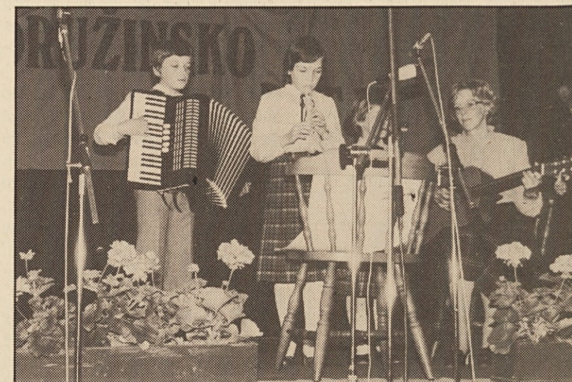
Družinsko petje — prireditev KKZ — je tudi letos privabilo veliko število nastopajočih in poslušalcev.

Dunajski Madrigalchor ni smel peti v pliberškem Grenzlandheimu: Dunajčane so namreč povabili Slovenci.