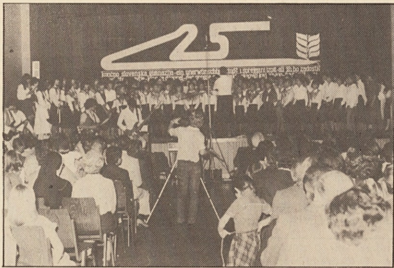
Maja letos je Slovenska gimnazija obhajala 25. jubilej.

Rožanski izobraževalni teden je bil letos brezdvomno najbolj uspešni v sedemletni „zgodovini“ te ustanove. Predaval je