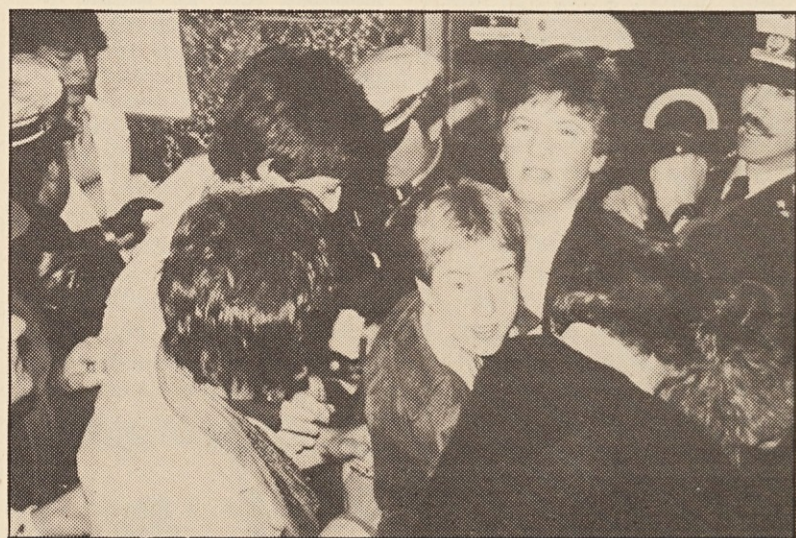
Kolodvorska akcija KDZ: policija je ravnala baje kot „nemški angelček“.