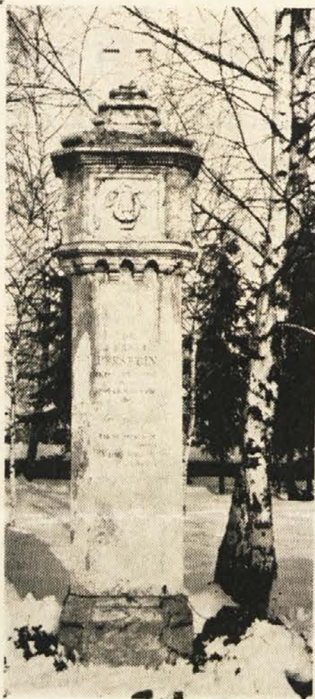
Prešernov nagrobni spomenik v Kranju

Ob letošnjem kulturnem prazniku, ki ga bomo obhajali prihodnji teden, objavljamo iz Prešernovega življenjepisa odlomek, ki pripoveduje o pesnikovih mladostnih in študijskih letih.