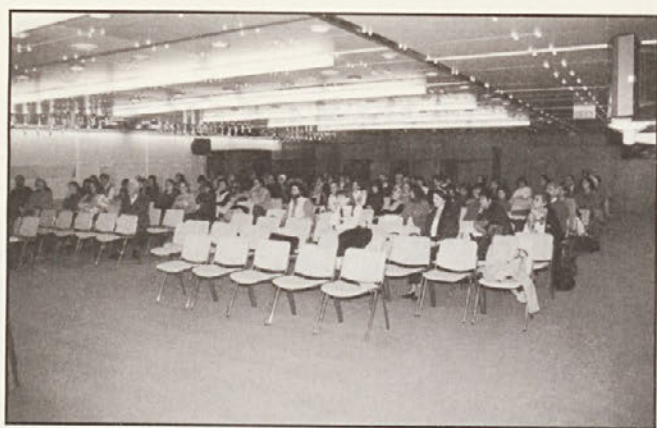
Kongres v Cankarjevem domu.