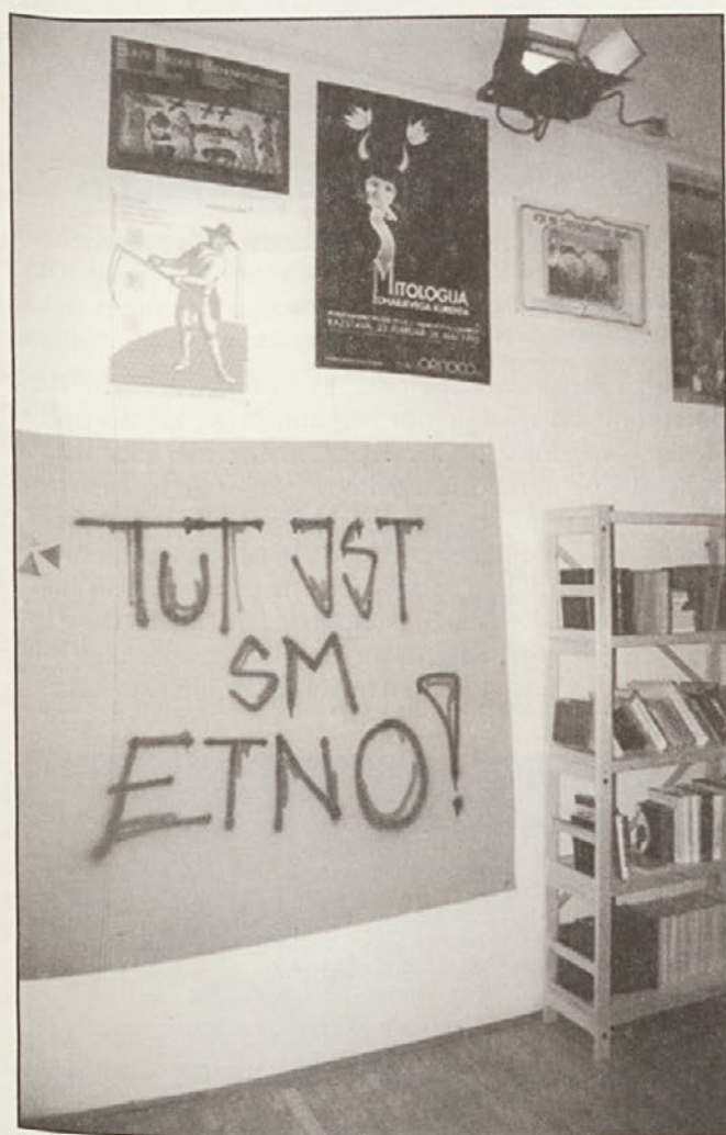
Razstava Sto let etnoloških prizadevanj na Slovenskem v SEM.

Minil je pomemben dogodek v zgodovini naše vede: slovenski etnološki jubilejni kongres, ki smo ga poimenovali Razvoj slovenske etnologije od Štreklja in Murka do sodobnih etnoloških prizadevanj . S petdnevni kongresom - od ponedeljka, 23. 10., do petka, 27. 10. 1995 - smo počastili stoletnico Štrekljeve izdaje prvega snopiča Slovenskih narodnih pesmi in Murkovega poročila o vseslovanski etnološki razstavi v Pragi na Češkem, dve simbolni točki začetka znanstvenih etnoloških prizadevanj na Slovenskem. Poleg teh dveh simbolov obdobja, ko se je na etnološkem področju pri nas dogajalo še več pomembnih stvari, smo s kongresom počastili tudi dvajset let Slovenskega etnološkega društva, ki je nastalo z združitvijo obeh predhodnih narodopisnih društev, in petinpetdeset let univerzitetnega študija etnologije.