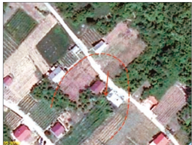
Sl. 2. Približne meje plazu Fig. 2. Approximate contours of a landslide

V neposredni bližini podorov pod Šempavelsko goro se je leta 2003 sprožil plitev zemeljski plaz (slika 2). Plaz, širok okoli 50 m in dolg 60 m, je nastal v vinogradu na osrednjem delu jugozahodnega pobočja z naklonom 20°–30° (DOKL & ZORIČ, 2003). Pri tem so bili poškodovani vinograd, javna pot, oporni in podporni zidovi (slika 3) ter trije objekti (zidanice), od katerih so morali enega kasneje porušiti v celoti. Z vrtnanjem so na območju plazu določili sestavo preperinskega pokrova, ki je debel dobre 4 m. V preperini se po-