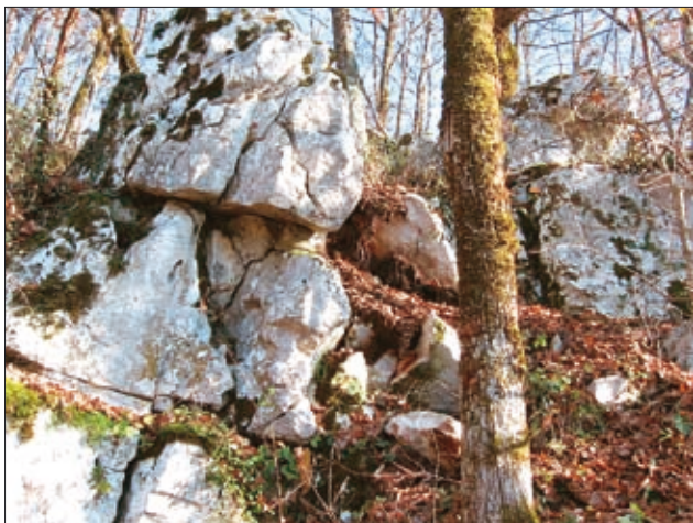
Sl. 4. Nestabilni bloki apnenca na grebenu