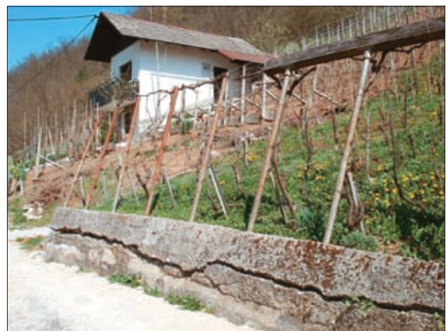
Sl. 3. Poškodovan zid na območju plazu Fig. 3. A damaged wall on landslide area