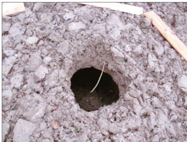
Sl. 7. Udor od blizu