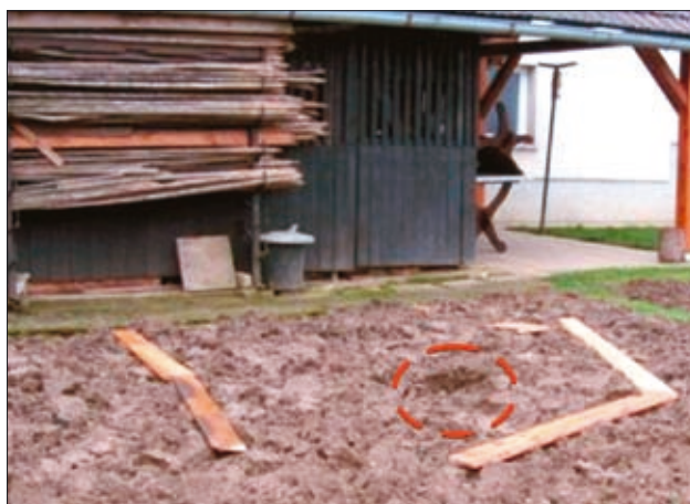
Sl. 6. Udor za hišo v Dolenjskih Toplicah

Konec leta 2009 je po obilnem deževju na vrtu za stanovanjsko hišo v Dolenjskih Toplicah nastal manjši udor, skoraj idealno okrogla odprtina s premerom in globino preko enega metra (sliki 6, 7). Podlago tvori jurski apnenec, ki ga prekrivajo glinaste zemljine. Po besedah lastnice hiše, je izkop za 10 let staro hišo v celoti potekal v glini in je bil brez posebnosti. Udor je nastal brez kakršnih koli predhodnih znakov, verjetno zaradi izpiranja glin v kraške kanale. Ena od značilnosti dolenskega krasa je tudi, da se podtalnica nahaja plitvo pod površjem (KNEZ et al., 2004). Njena gladina zelo niha in pri tem izpira material; pojav se imenuje podpovršinska erozija vode ( http://www.mgs.md.gov/esic/fs/fs11.html ), dodatno pa je k izpiranju prispevalo še obilno deževje.