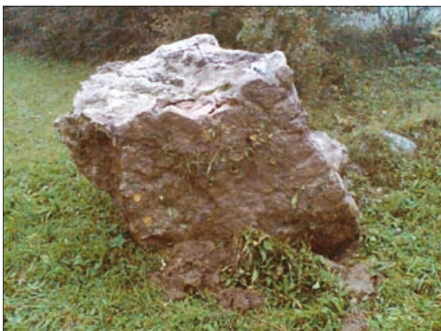
Sl. 5. Podorni blok iz leta 2008

Dva večja apnenčeva bloka sta se sprožila v letih 2005 in 2008. Na način gibanja podornega bloka prizmatične oblike iz leta 2008 (slika 5), dimenzij cca 1,5 m x 1,2 m x 1 m, je vplival naklon pobočja, ki v odlomnem delu znaša okoli 45^\circ , nato pa se zmanjša na 25^\circ do 30^\circ . Blok se je po pobočju izmenoma kotalil in odbijal, vse do ravnine. V obdobjih sprožitve blokov na območju Žužemberka in v njegovi okolici ni bil zabeležen noben potres, tako da njune sprožitve ne moremo povezati s potresom (ARSO, 2007, 2009).