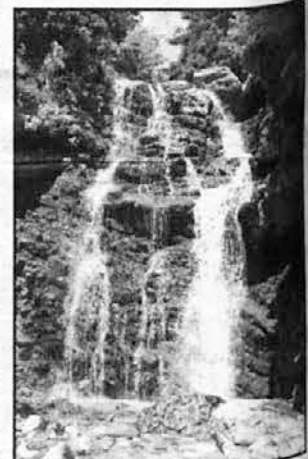
Slap nad Zarižami