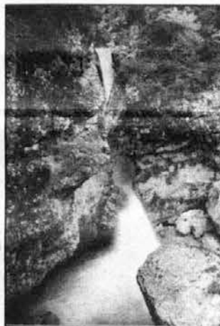
Veliki Možniški slap