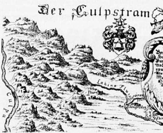
Iz Valvasorjeve »Slava vojvodine Kranjske« — grb Slovenske maske

kmečki puntarji. Toda zdi se, da ne gre za puntarski znak kot takšen, pač pa za star karantanski simbol. V grbu Henrika, sina in samega koroškega vojvode Majnarda, je v okrasju klobuk s čopom pete-