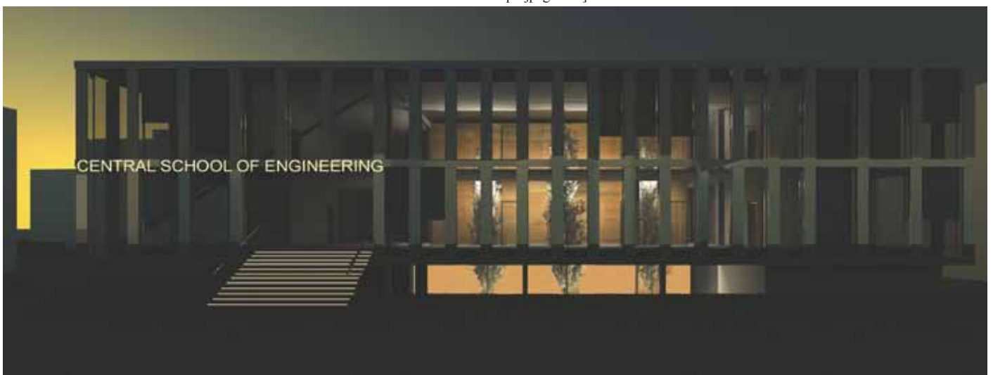
Slika 5: Central 2009. Pogled [http://pbl.stanford.edu/AEC%20projects/projpage.htm].