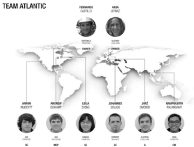
Slika 1: Atlantic2012. Interdisciplinarne in multinacionalne skupine z mentorji [http://pbl.stanford.edu/AEC%20projects/projpage.htm].