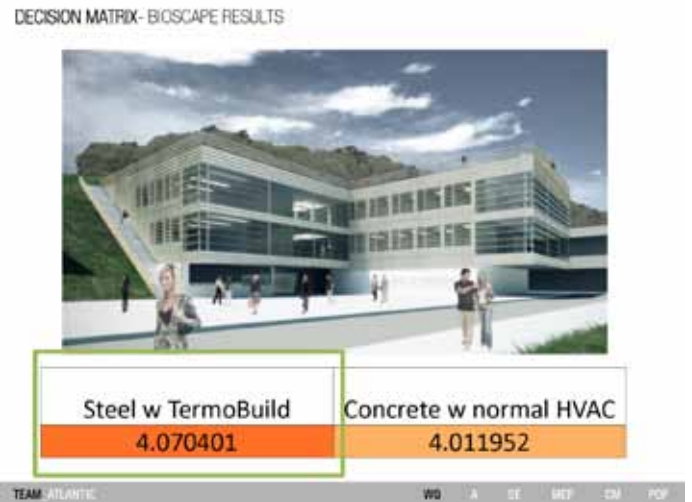
Slika 2: Atlantic 2012. Odločanje [http://pbl.stanford.edu/AEC%20projects/projpage.htm].