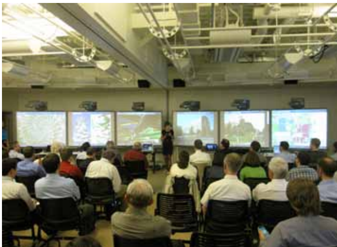
Slika 3: Končne predstavitve na šestih panojih.