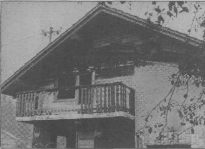
S pomočjo krajanov je hiša Angele Kozole spet pod streho

som in z delom. Treba je bilo poskati drevje, odpeljati les na žago, ga pripeljati nazaj, očistiti hišo, odpeljati odpadke... Bilo je nešteto opravil, pri katerih so se še zlasti izkazali nekateri sosedje