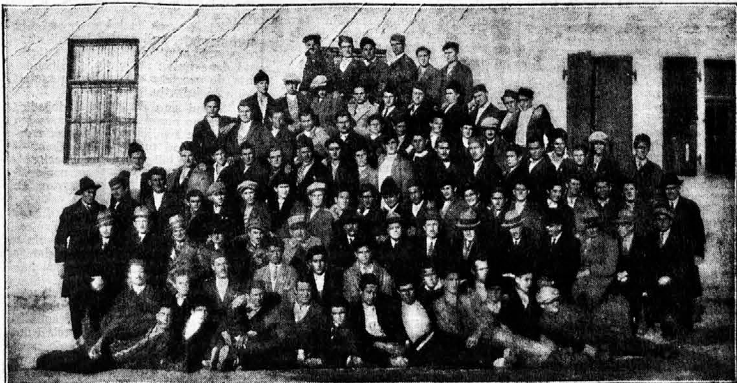
III. tečaj za vođe sokolskih četa Sokolske župe Mostar

I pored neprestanog rada i vežbe skoro svi su ostali zdravi (izuzevši 3-4 slučaja nahlade), a na vagi su dobili od 1 do 6.50 kg. Nedelje su bile određene za ekskurzije ali zbog jake zime održane su samo dve.