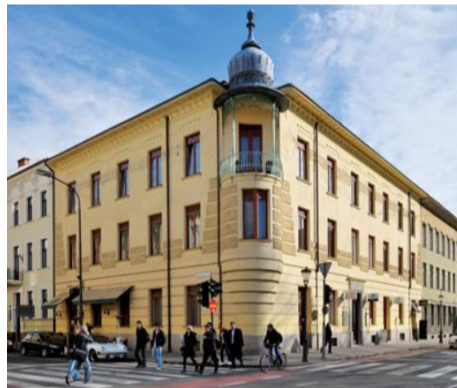
Krisperjeva hiša, Ljubljana

Pred šestdesetimi leti je v Gorici umrl arhitekt Maks Fabiani. Bil je prvi slovenski arhitekt z doktoratom iz urbanizma, univerzitetni profesor na Dunaju, slikar, pisatelj, inovator, humanist, popotnik, politik in vizionar. Zasnoval je prvi urbanistični načrt za obnovo popotresne Ljubljane konec 19. stoletja, po katerem se je kasneje zgledoval arhitekt Jože Plečnik. Njegova dela najdemo v Avstriji, Sloveniji, Italiji, na Poljskem in na Hrvaškem.