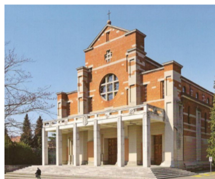
Cerkev svetega srca, Gorica

Med letoma 1935 in 1945 je bil župan Štanjela. Leta 1947 se je preselil v Gorico. Leta 1952 mu je Dunajska univerza podelila zlati doktorat. Umrl je v Gorici 12. avgusta 1962 in bil tam tudi začasno pokopan. 12. februarja 1984 so njegove posmrtno ostanke prenesli na majhno pokopališče sv. Gregorja v Kobdilju.