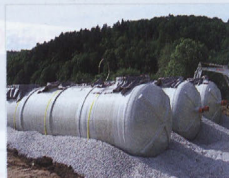
Postavitev čistilne naprave 1000 PE, sestavljene iz treh cistern, ki je sedaj v celoti zasuta (slika levo).

v zvezi s pridobivanjem projektne dokumentacije, služnostnih pogodb, oziroma pridobiti pravico gradnje na privatnih zemljiščih in pridobiti dovoljenje za gradnjo. V nadaljevanju so bili izvedeni postopki na podlagi JZN za izbiro najugodnejšega izvajalca del, izvajalca