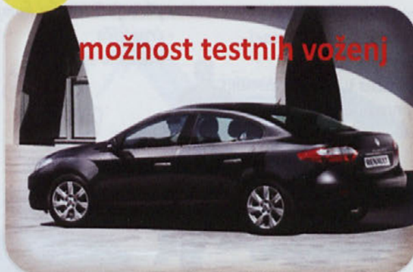
Renault Fluence že za 14.120€*