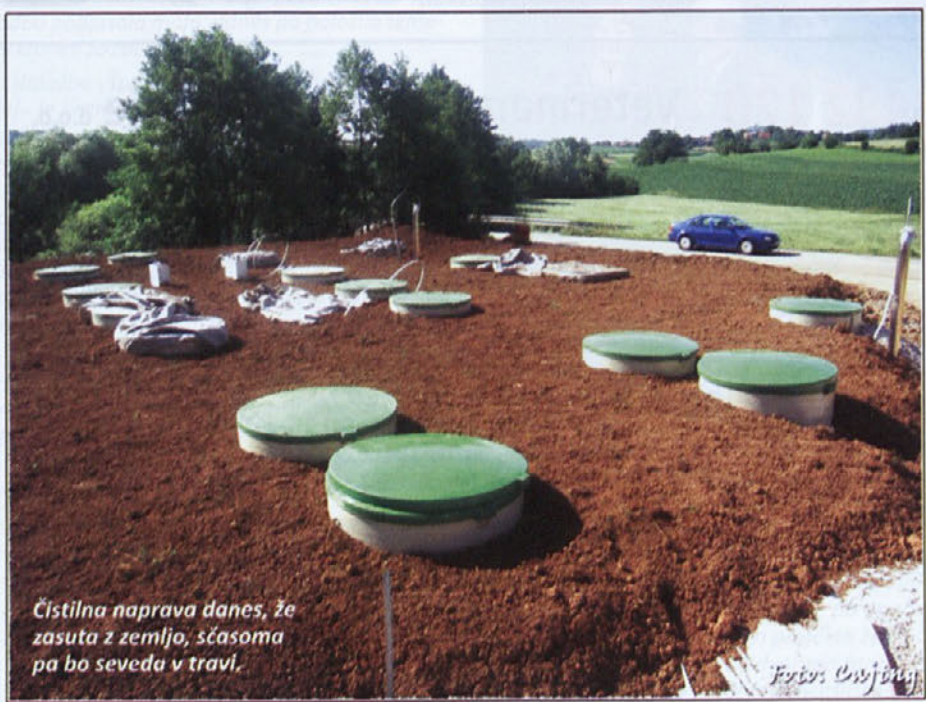
Čistilna naprava danes, že zasuta z zemljo, sčasoma pa bo seveda v travi.