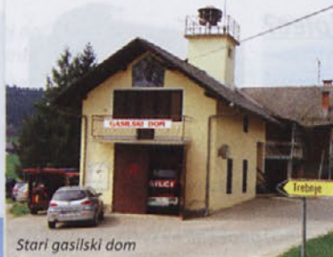
Stari gasilski dom

Konec aprila smo pisali, da dobrniški gasilci gradijo nov dom. Gradnja se je v Dobrniču začela čisto od začetka, od temeljev. Znano je, da je za gasilce značilna