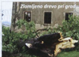
Zlomljeno drevo pri gradu