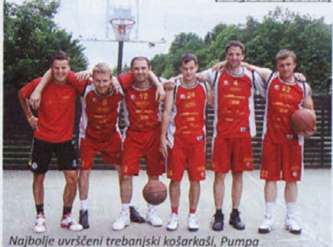
Najbolje uvrščeni trebanjski košarkarji, Pumpa