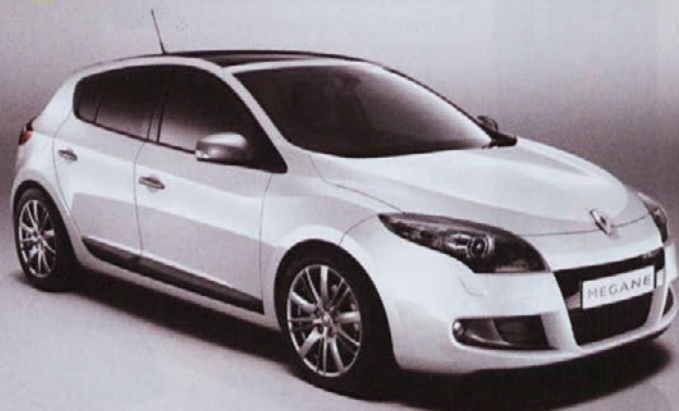
Megane GT Line (športni paket)