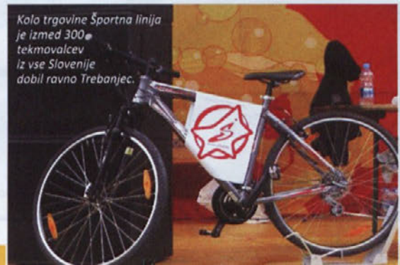
Kolo trgovine Športna linija je izmed 300 tekmovalcev iz vse Slovenije dobil ravno Trebanjec.