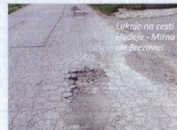
Luknje na cesti Hudeje - Mirna pri Brezovici.