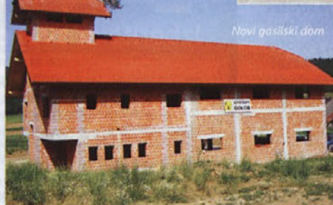
Novi gasilski dom

hitrost in iznajdljivost v vsaki situaciji, zato smo malo preverili, kako gradnja poteka dober mesec in pol kasneje. (Več na www.cajitng.com ) Nekateri pravijo, da je Dobrnič kraj, ki je dober in nič nima, vendar so se krajani ob tej priložnosti izkazali v ravno nasprotni luči. Ljudje so stopili skupaj, pomagali gasilec z lesom, denarnimi prispevki, hrano in pijačo ter spodbudnimi besedami in se jim na tak način zahvalili, da čuvajo njihove domove in izobražujejo mladino pred požari. Naj bo takih prizorov čim več!