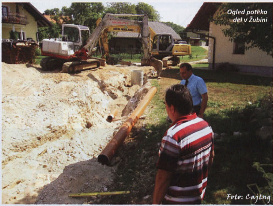
Ogled poteka del v Žubini