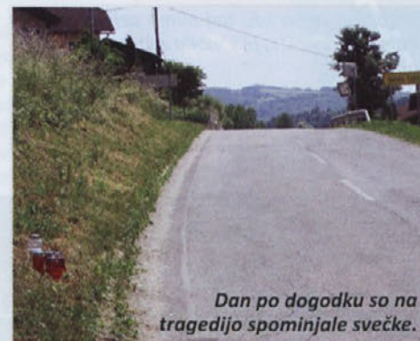
Dan po dogodku so na tragedijo spominjale svečke.

Tomaž Gole s.p., Repče 27, Trebnje Več info: www.rabljena-vozila.si e-pošta: info@rabljena-vozila.si