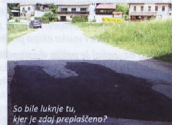
So bile luknje tu, kjer je zdaj preplastičeno?

www.cajtng.com - 09.06.2010 - Bralec, domačin s Ponikev, nas je obvestil, da je cesta Dolenja Nemška vas - Ponikve, neposredno pod mostom, v luknjah. Nevarna bi naj bila, ker bi se naj vsi vozniki luknjam izogibali, s tem zapeljali bolj proti sredini ceste, takrat pa je znal z nasprotne strani pripeljati avto. Bralec je še dodal, da je nemalokrat le malo manjkalo, da se vozil nista zaleteli, gume na vozilih da pa so že "sekali".