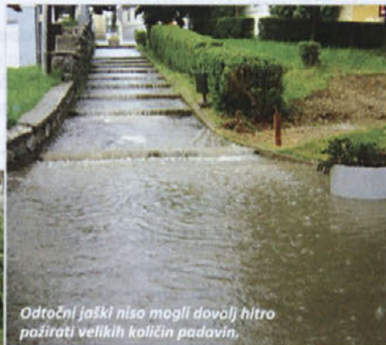
Odočni jaški niso mogli dovolj hitro požirati velikih količin padavin.