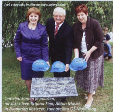
(več o dogodku in slike na www.cajtng.com )

lahko začela: zakoličba terena, postavitev zaščitne ograje, na gradbišče naj bi prišli tudi prvi gradbeni stroji. Zemeljski izkopi naj bi bili zaključeni do sredine avgusta, gradbena dela do oktobra, športna dvorana pa naj bi bila novembra že pokrita. Sledila bi ostala dela in opremljanje. Pogodba predvideva tehnični prevzem konec aprila, a v Trimo upajo, da se bo to zgodilo že v začetku marca prihodnje leto. Trimo bo poskušal za podizvajalce izbrati čim več domačih obrtnikov.