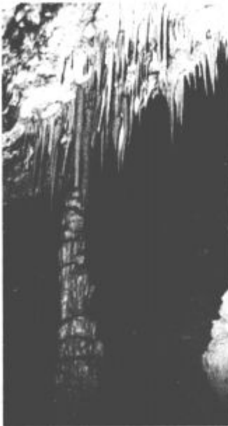
Steber — ena izmed privlačnosti jame