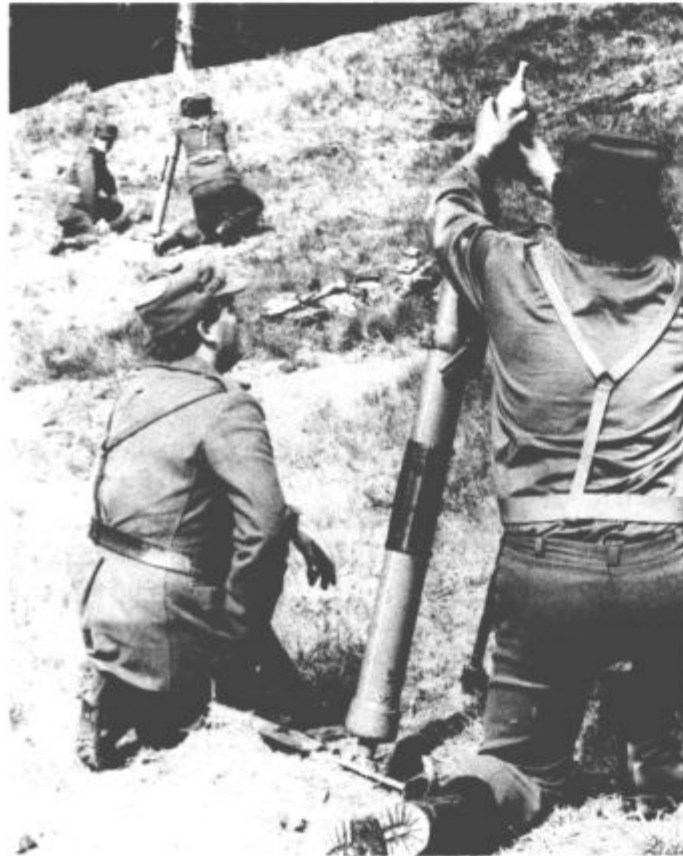
Delo z minometi je odgovorno in natančno