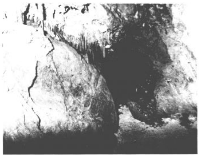
Kam pelje pot?