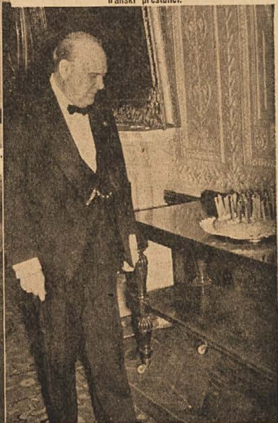
Devetinšestdeseti rojstni dan g. Churchilla v Teheranu. Churchill občuduje svojo torto z 69 svečkami.