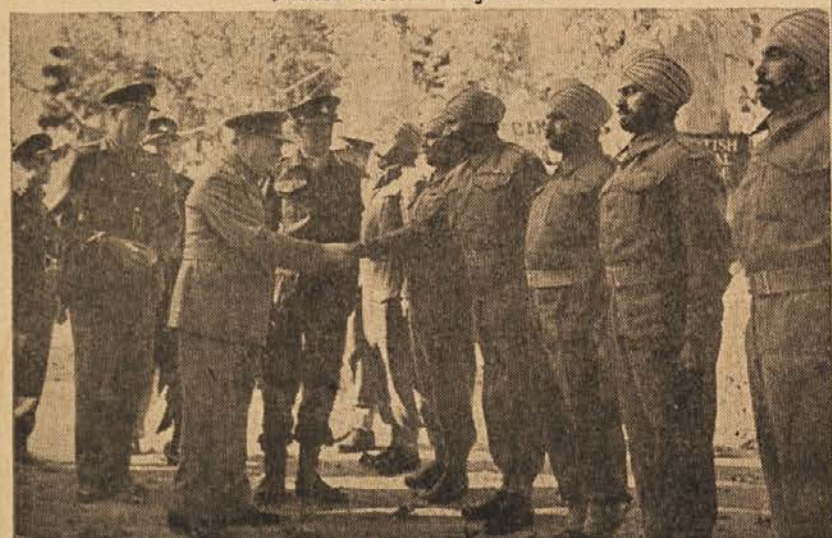
Predsednik vlade Velike Britanije pozdravlja Indijske vojake