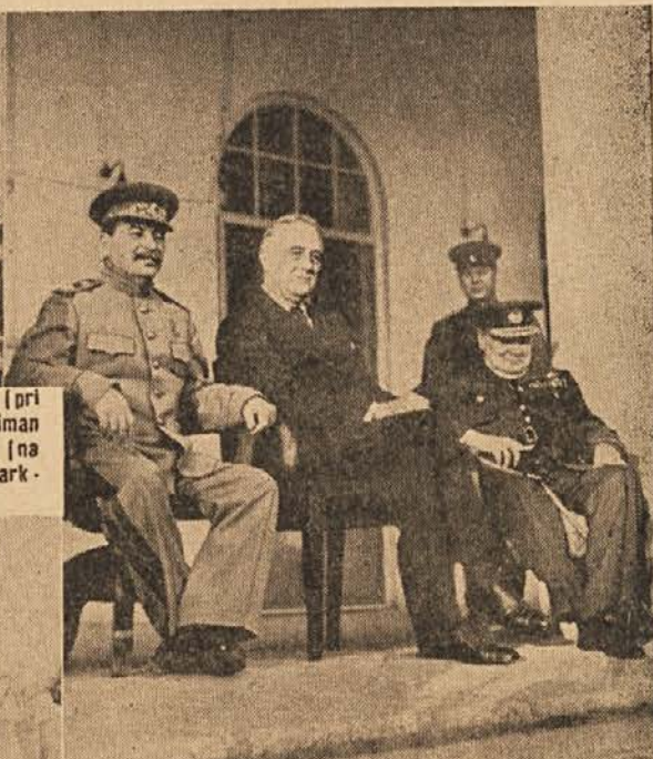
Zgodovinski sestanek Churchill - Staljin - Roosevelt v Teheranu. Slika je posneta na stopnicah sovjetskega poslanstva v iranski prestolici.