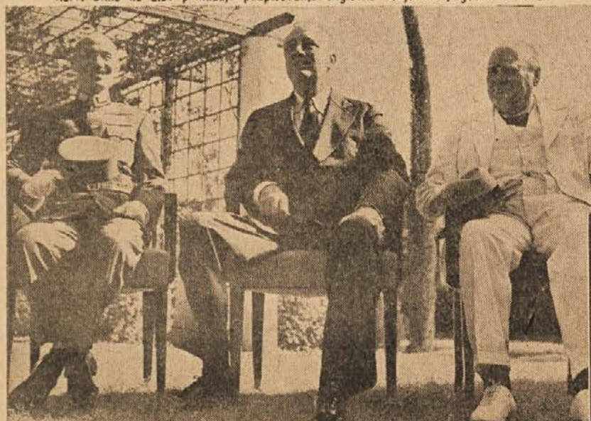
Konferenca v Kairu, na kateri je bila izdana Tihooceanska poslanica: marsal Chiang-Kai-Chek, prezident Roosevelt in g. Churchill.