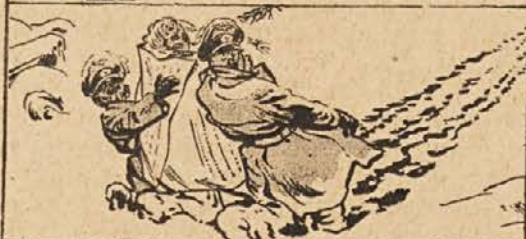
ZAHVALA SV. ANTONU

Prierčno te prosim, svetnik ti Anton usliši to prošnjo gorečo, prinesla sem tebi za god na oltar te rože dehteče in svečo.