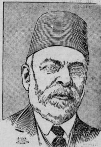
Izmall Kemal bej, šef provizorične albanske vlade.

Velika požrtvovalnost, ki jo kaže vsa bulgarski narod za vojno, izpričuje dogodek iz Jambola. To mesto leži blizu meje ob železnici in zato tja pripeljejo jako veliko ran-