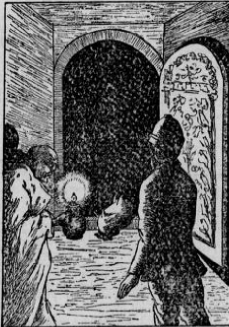
Dospeli smo do lepo slikanih odprtih vrat. Na pragu je ležala vreča iz kozje kože...

Šli smo po hodniku kakih petnajst korakov dalje in dospeli do lepo