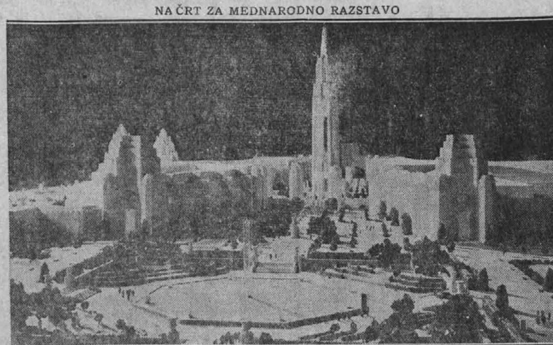
Mesto San Francisco, Cal., bo imelo v letu 1939 takozvano "Golden Gate" mednarodno razstavo in gornja slika kaže vzorec, izdelan iz gipsa, predstavljajoč del nameravanih razstavnih prostorov. Ta vzorec sam je stal $10,000. Ob istem času s to razstavo pa se bo vršila tudi na drugem koncu Amerike, v New Yorku, svetovna razstava, toda obe mesti se se sporazumeji, da ne bo nobene konkurence med njima.

Pri Petanjcih bodo v kratkem začeli z gradnjo novega mostu čez Muro, ki bo stal tri milijone dinarjev. Dolžina novega mosta preko struge bo znašala 95 metrov. Most bo imel tri razpetine in bosta radi tega zgrajena sredi struge dva močna oporna stebra. Poleg tega bodo zgradili še dva stranska in tri manjše stranske mostove v občestnem nasipu.