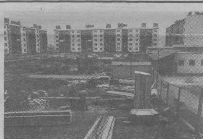
Gradnja prizidka k vrtcu v Novih Jaršah