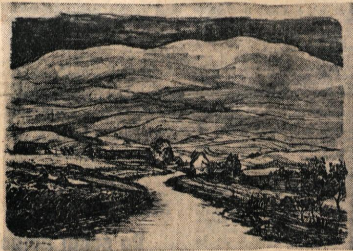
Vlado Lamuti: POD GORJANCI

Treba pa bo na vsak način rešiti tudi vprašanje potujočega kina, ki bi lahko prisel tudi v najbolj oddaljene oz. odročne kraje Bele krajine in tam ljudi učil in razveseljeval. Pb.