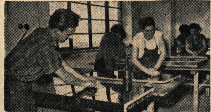
Poliranje pohištvenih delov brežiški tovarni pohištva, ki večino svojih kvalitetnih izdelkov z lahkoto proda v inozemstvo