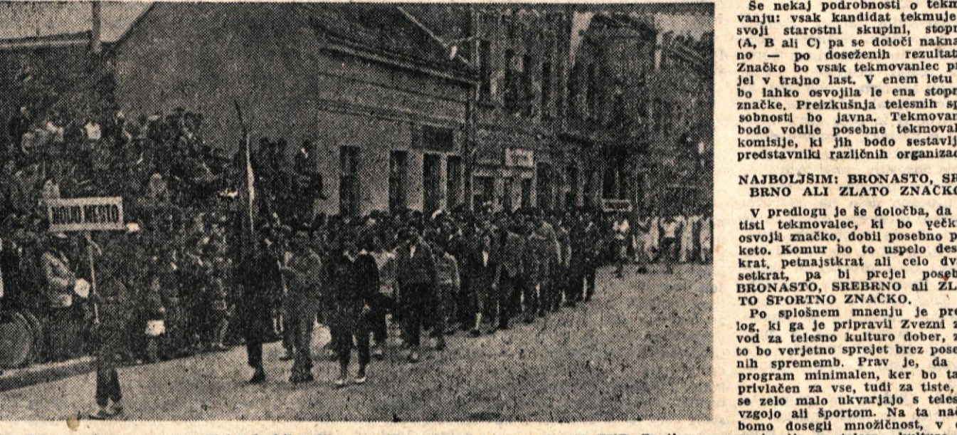
Zlet Bratisva in enotnosti v Sisku je bil velika manifestacija dela organizacij TVD Partizanov. Prihodnji zlet Bratisva in enotnosti bo prihodnje leto v Novem mestu...