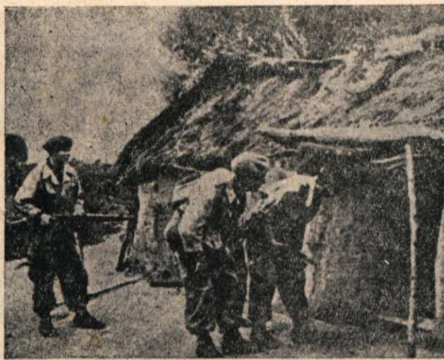
Vsakdanja podoba iz Alžirije: pripadniki francoskih padalskih čet preiskujejo alžirsko vas. Ni treba poudarjati, da nimajo kar nič prijateljskih namenov in revež je tisti Alžirec, ki jim pade v roke. Teror v Alžiriji se nadaljuje, borba za osvoboditev postaja čedalje hujša.

Drina, z energijo vode najbogatejša jugoslovanska reka, bo v prihodnosti gnala 30 hidrocentral. Spremenila se bo v niz stopničasto razvrščenih jezer, ki bodo povezana z daljšim ali krajšim rečnim tokom. Prvo jezero na Drini — Zvorničko , je nastalo z zgraditvijo jezcu pri Malem Zvorniku. Dolgo je 27 km in pokriva 800 ha površine. Nova jezera na Drini bodo mnogo večja: projektirano jezero Velike Dobrvice bo dolgo 162 km, Male Dobrvice 77, Peručac 59 km.