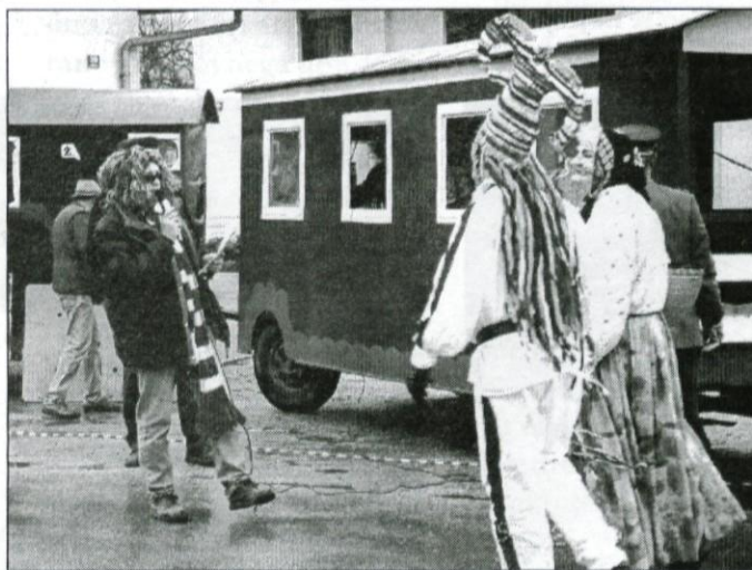
Napovedovalec najavlja prihod "ta starega in ta stare"