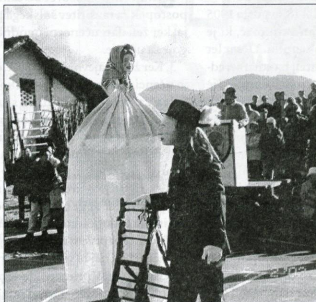
Slika zgoraj: Poroka