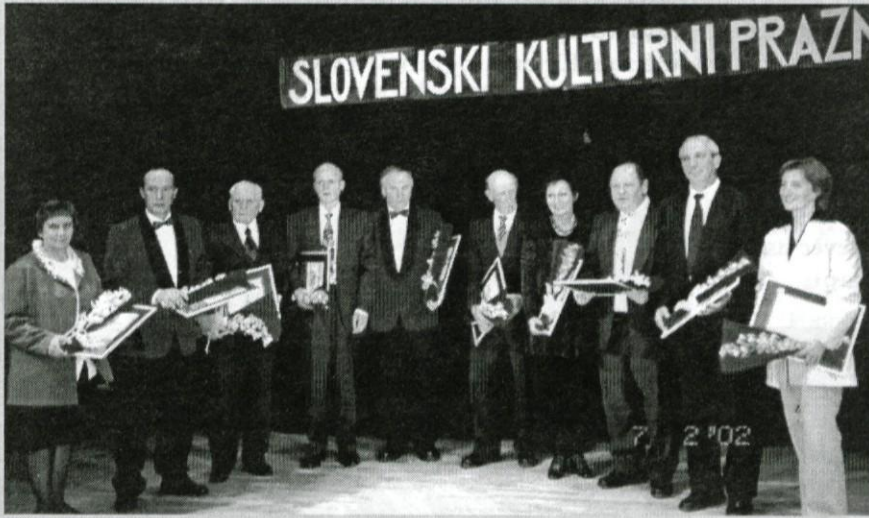
Dobitniki Jurčičevih priznanj iz vseh treh občin

Osrednja proslava s podelitvijo Jurčičevih priznanj je bila v Jakličevem domu na Vidmu