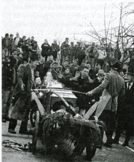
Slika spodaj: "Babji maln"