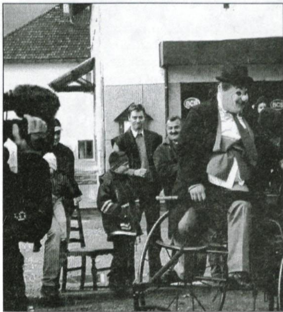
Najnovejši model traktorja