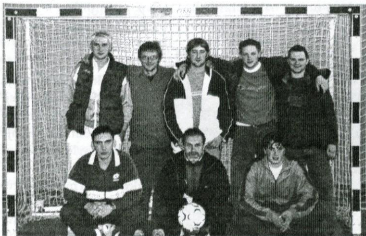
Ekipa ŠD Dobropolje Snežak, ki je osvojila 2. mesto na medobčinskem prvenstvu v malem nogometu (nekaj igralcev "upravičeno" manjka na sliki)

Medobčinsko prvenstvo v malem nogometu občin Grosuplje, Ivančna Gorica in Dobropolje je končano. Odlično sta se odrezali obe ekipi iz Dobropolja, ŠD Dobropolje Snežak in Okrepčevalnica Zora Kompolje, ki sta v rednem delu zasedli 2. in 3. mesto. Tako sta si obe ekipi pridobili pravico do igranja v t.i. play offu, kjer so se prve štiri ekipe potegovale za naslov medobčinskega prvaka, druge štiri pa za uvrstitev od 5. do 8. mesta.