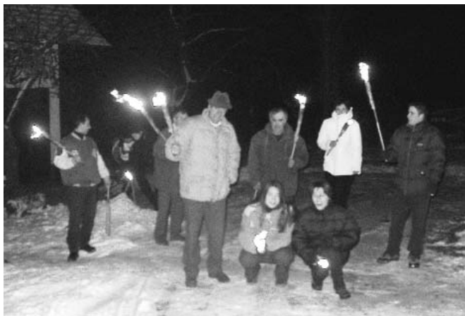
Pohodniki z baklami