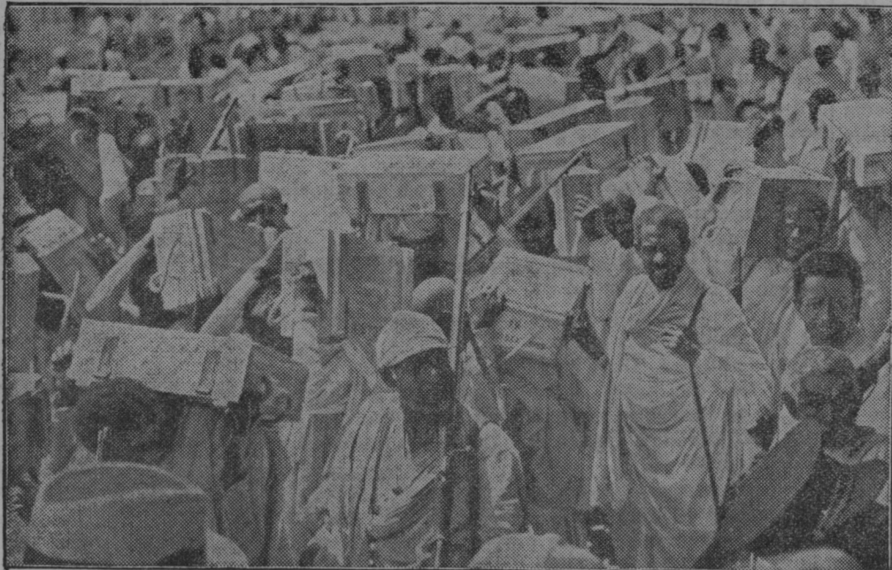
Prenos Abesincem namenjenega streliva in orožja. — Desno: Japonski letalec Ano je na svetovnem poletu iz Londona preko Evrope in Azije priletel na Japonsko.