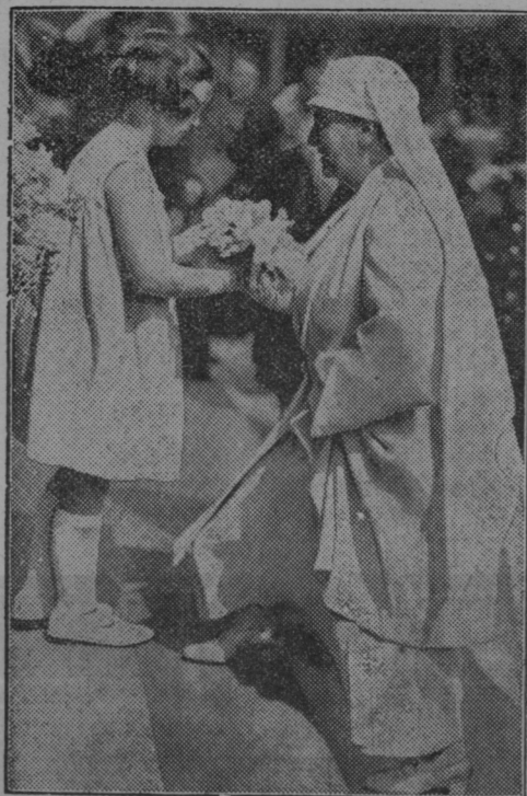
Holandska kraljica je obiskala svetovno razstavo v belgijski prestolici v Brüsselu.