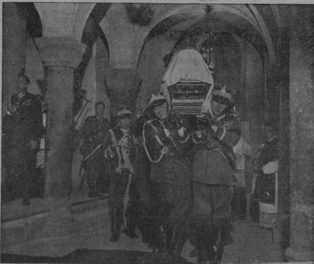
Poljskega maršala Pilsudskega nesejo generali k zadnjemu počitku na Wawelu pri Krakovu.