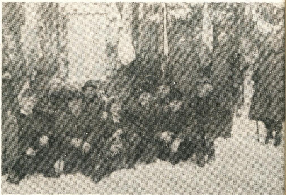
Osmo srečanje preživelih borcev na Kostanjski planini