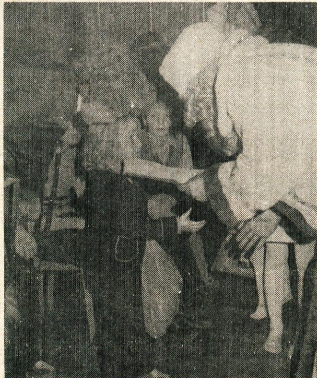
Kljub temu, da se dedek Mraz ni pripeljal v Kamnik na saneh, so se otroci njega in njegovih daril zelo razveselili

Tudi otroke delavcev občinske skupščine je pred novim letom obiskal dedek Mraz s spremstvom. Koša res ni imel, ker je bilo za toliko otrok preveč daril, ki so jih morali pripeljati kar z vozom, ker za sani ni bilo dovolj snega. Ko pa se je dedek Mraz poslovil in sedel v svojo »škodo«, je eden od najmlajših pripomnil: »Naš dedek se je pa kar s »škodo« pripeljal, ker je premalo snega za sani.«