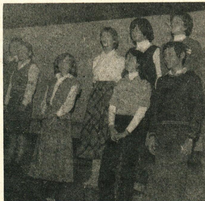
Nastop recitacijske skupine iz osnovne šole Toma Brejca ob praznovanju dneva JLA

Po proslavi je bilo v mali dvorani še tovariško srečanje.