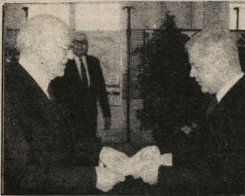
El embajador argentino en Eslovenia, dr. Jorge A. Taiana, entrega sus credenciales al presidente esloveno sr. Milan Kučan